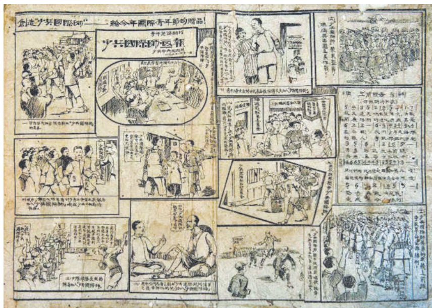
1933年,少共中央局出版的《青年实话》副刊“少共国际师画报”。(国家一级革命文物,现存于福建省建宁县中央苏区反“围剿”纪念馆) 资料图片