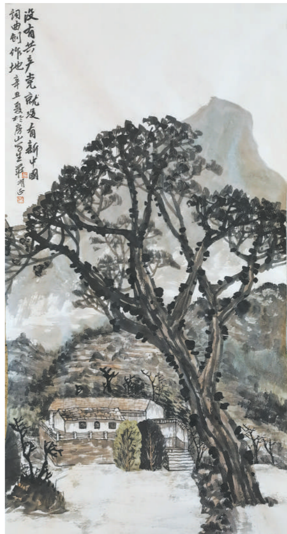
永远的旋律（中国画）