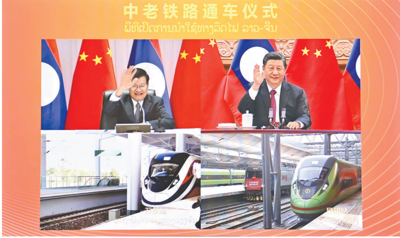
12月3日下午,中共中央总书记、国家主席习近平在北京同老挝人民革命党中央总书记、国家主席通伦通过视频连线共同出席中老铁路通车仪式。

新华社北京12月3日电 (记者郑明达)中共中央总书记、国家主席习近平12月3日下午在北京同老挝人民革命党中央总书记、国家主席通伦通过视频连线共同出席中老铁路通车仪式。 全国人大常委会副委员长、国家发展和改革委员会主任何立峰主持仪式。 中老双方有关部门和地方负责人、工程建设者代表、有关国家驻昆明总领事、驻老使节等分别在中国昆明分会场、老挝万象站分会场参加仪式。 老挝总理宋赛和中国国铁集团负责人分别向两国元首汇报通车准备情况。 两国元首分别致辞。 习近平代表中国共产党、中国政府和中国人民对中老铁路通车表示热烈祝贺,向两国建设者致以崇高敬意。 习近平指出,2015年,我同老挝领导人一道,作出了共建中老铁路的重大决策。开工5年来,中老双方齐心协力、紧密配合,逢山开路、遇水搭桥,高水平、高质量完成建设任务,以实际行动诠释了中老命运共同体精神的深刻内涵,展现了两国社会主义制度集中力量办大事的特殊优势。 习近平指出,中老铁路是两国互利合作的旗舰项目。铁路一通,昆明到万象从此山不再高、路不再长。双方要再接再厉、善作善成,把铁路维护好、运营好,把沿线开发好、建设好,打造黄金线路,造福两国人民。(下转第二版)