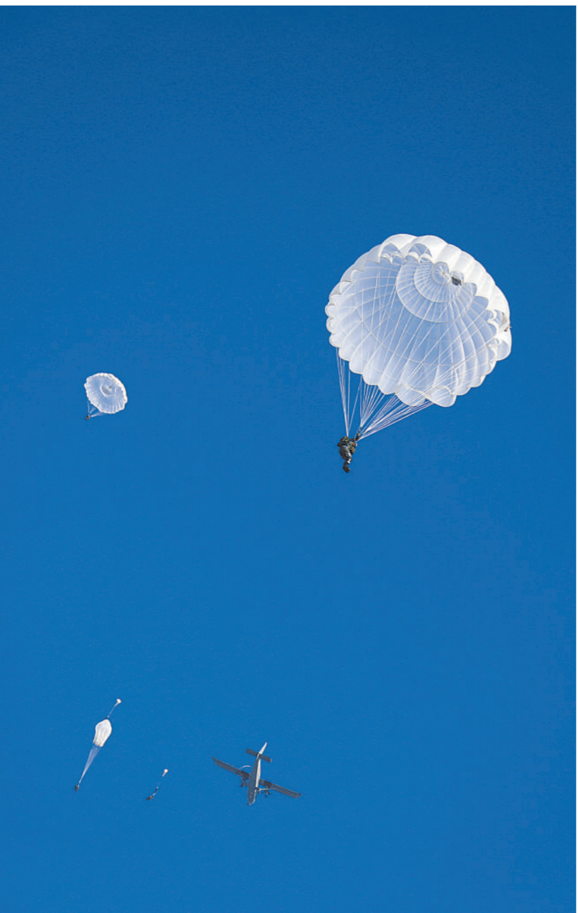
左图：12月上旬，空降兵某旅组织新兵跳伞训练。

辉煌成就催人奋进，使命在肩奋力出征。连日来，该旅演训场上一派生机勃勃虎练兵景象，官兵围绕演训中暴露出的问题短板展开集中攻关，持续掀起精武强能热潮。