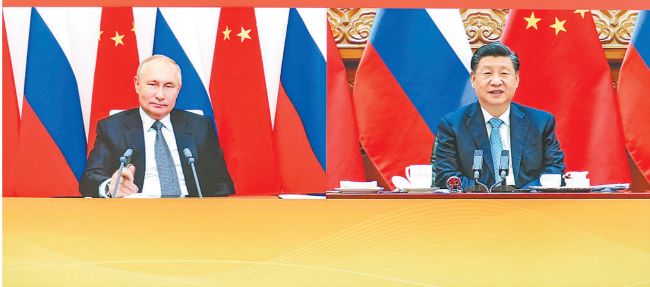
12月15日下午,国家主席习近平在北京同俄罗斯总统普京举行视频会晤。

ВСТРЕЧА ПРЕДСЕДАТЕЛЯ КНР СИ ЦЗИНЬПИНА И ПРЕЗИДЕНТА РФ В. В. ПУТИНА В ФОРМАТЕ ВИДЕОКОНФЕРЕНЦИИ