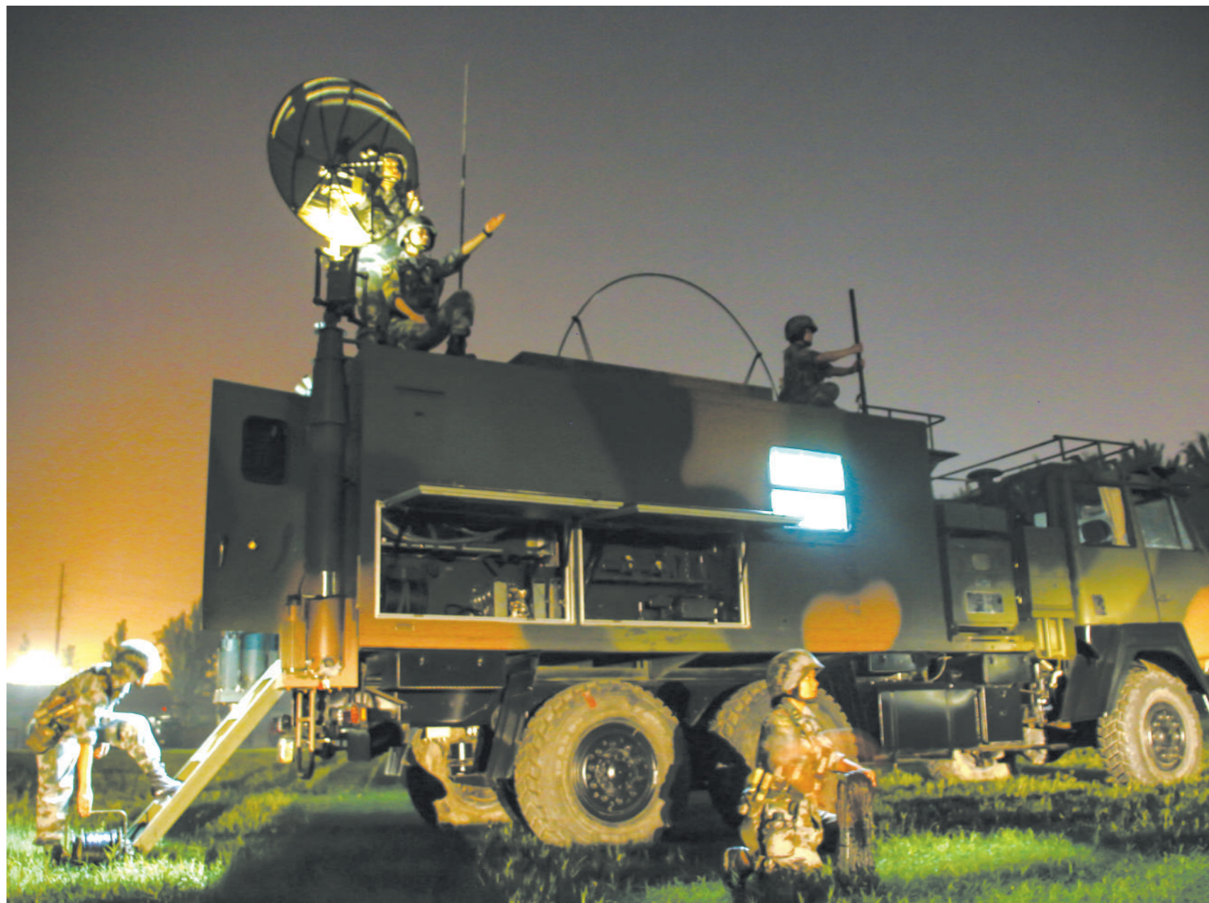
第83集团军某旅通信专业分队正在组织夜间训练。