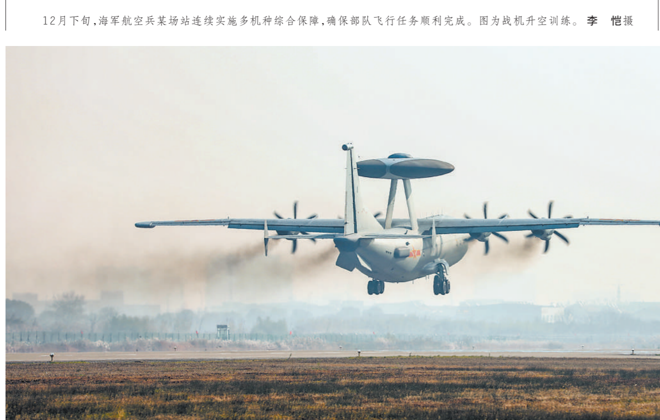
12月下旬,海军航空兵某场站连续实施多机种综合保障,确保部队飞行任务顺利完成。图为战机升空训练。

真正的英才才俊,不是才疏学浅之辈能简单识别的。打造能够担当强军重任的一流军事人才,迫切呼唤具有较高素质的领导干部。这就需要领导干部强化“自我成才”意识,把历练成才作为终身课题,努力成为新时代的伯乐,切实提高选人用人实际本领,为人才成长进步发挥示范引领作用。