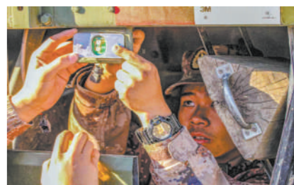
巡逻出行,我们精心保障。