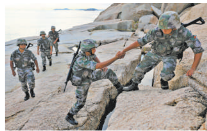
一起训练,一起巡逻,我们一起品尝军营酸甜苦辣。