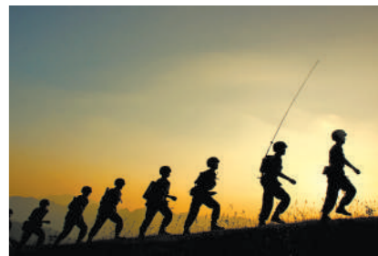
我们用脚步丈量边防防线。