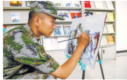
拿起手中画笔,描绘边关多彩生活。