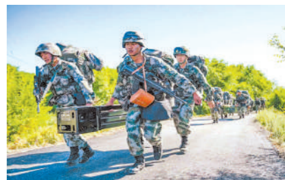
只要祖国一声召唤,我们唱起战歌奔向远方。