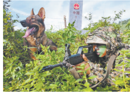
致敬身边的特殊“老兵”,我们一路同行。