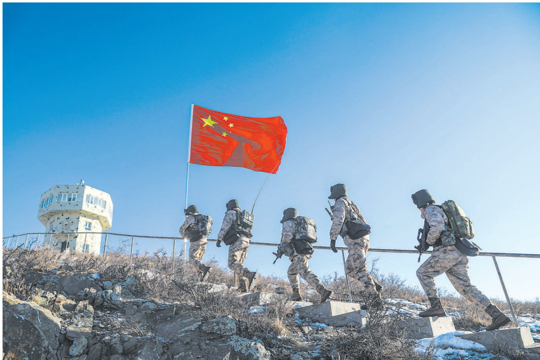
1月11日,新疆军区库则边防连执勤分队展开巡逻。图为官兵经过观察哨楼。

最初的那根“英雄绳”陈列在连队荣誉室里,新兵下连、新干部任职的第一课都会提到它。而新的“英雄绳”也接过了使命,继续保护着巡逻官兵走过长白山的沟沟坎坎。