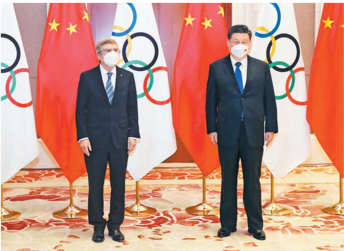
一月二十五日,国家主席习近平在北京钓鱼台国宾馆会见国际奥委会主席巴赫。

新华社北京1月25日电 国家主席习近平25日下午在北京钓鱼台国宾馆会见国际奥委会主席巴赫。 习近平表示,今天是中国农历小年,过几天就要过大年。欢迎你今年跟我们