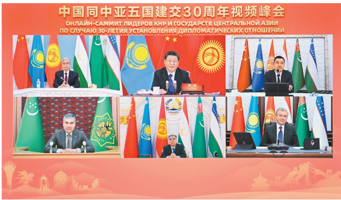
1月25日下午,国家主席习近平在北京主持中国同中亚五国建交30周年视频峰会,发表题为《携手共命运 一起向未来》的重要讲话。哈萨克斯坦总统托卡耶夫、吉尔吉斯斯坦总统扎帕罗夫、塔吉克斯坦总统拉赫蒙、土库曼斯坦总统别尔德穆哈梅多夫、乌兹别克斯坦总统米尔济约耶夫出席峰会。