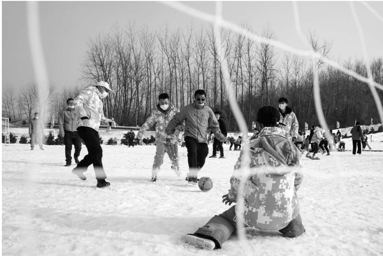
江苏省淮安市盱眙县铁山寺滑雪场举行“欢乐迎冬奥”雪地趣味运动会,百余名冰雪爱好者参加了雪地拔河、雪地竞速、雪地足球等项目的比赛。

“我国经济长期向好的基本面没有变,构建新发展格局的有利条件没有变,新的经济增长点将不断涌现。”宁吉喆强调,下一步,我国经济增长的动能不仅来自需求“三驾马车”的拉动,而且来自供给的推动;不仅来自内需的扩大,而且来自外需的拓展;不仅来自消费的增长,而且来自投资的发展;不仅来自改革的推进,而且来自创新的带动。“我国有信心、有底气,也有能力、有条件,实现经济持续健康发展。”