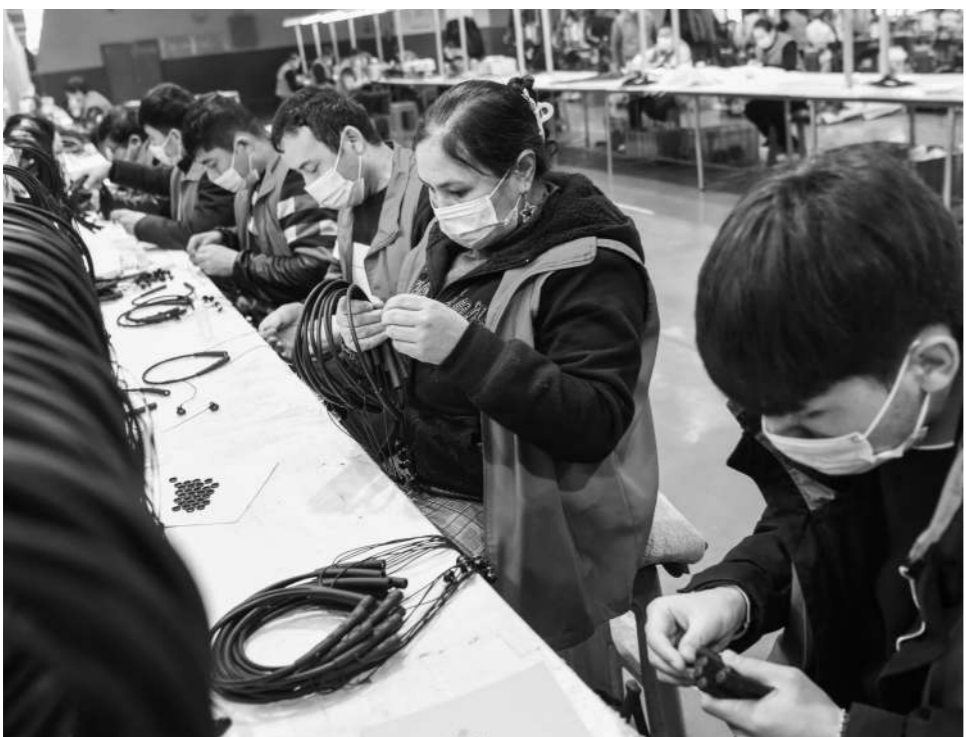
地处塔克拉玛干沙漠边缘的新疆墨玉县曾是国家级深度贫困县。近年来,当地将招商引资作为产业发展的助推器,构建现代产业体系。截至目前,墨玉县产城融合园已入驻企业17家,带动就业超过3000人。