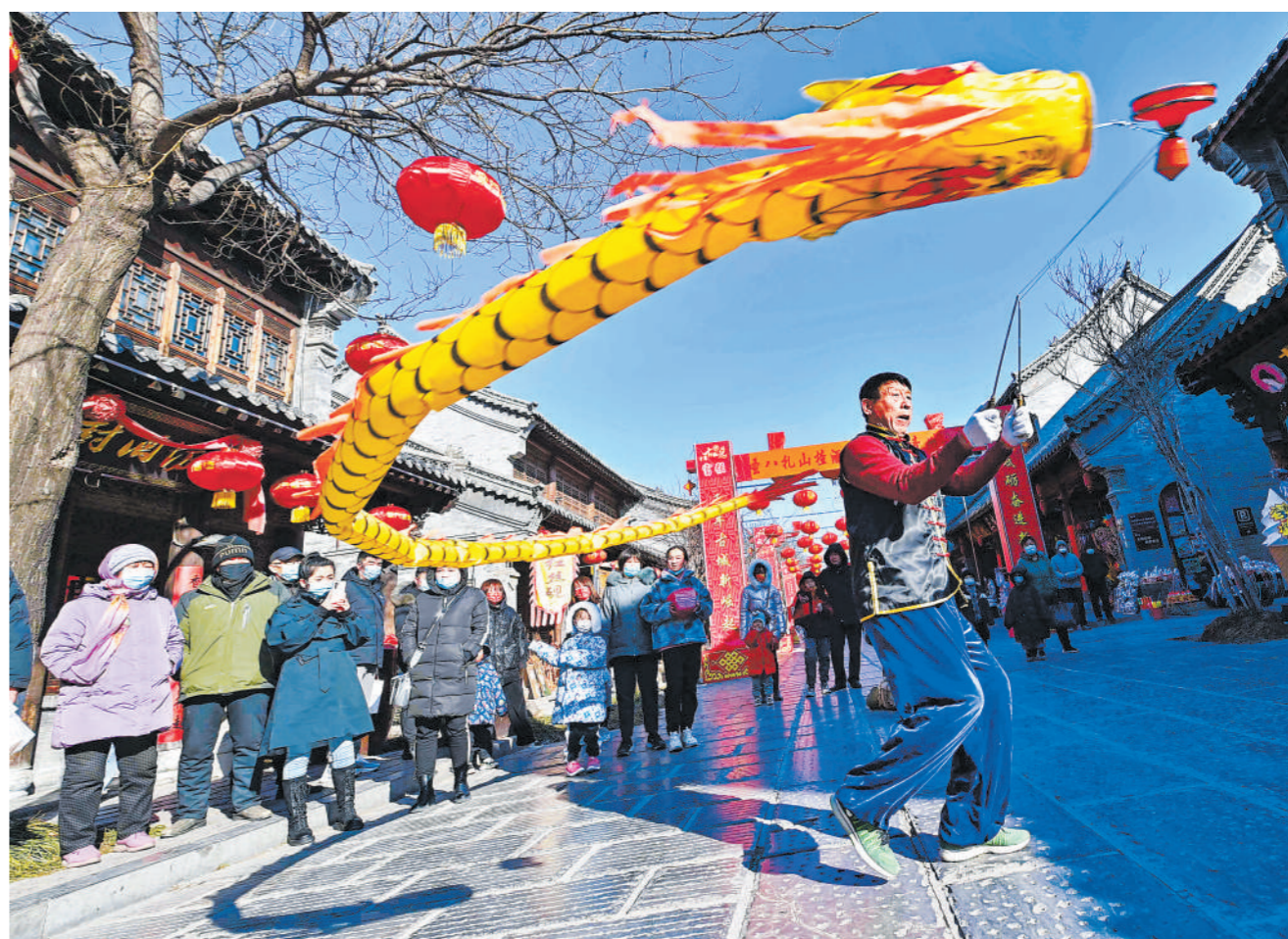
花样生活 乐享假期