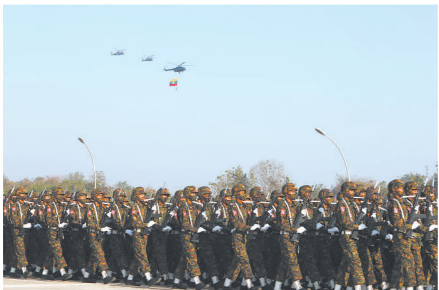
1947年2月12日,緬族、掸族、克钦族和钦族领导人在緬甸北部掸邦彬龙镇签署《彬龙协议》,同意建立统一的緬甸联邦,共同脱离英国殖民统治。此后,2月12日定为緬甸联邦节。图为联邦节当天,军人在緬甸首都内比都举行的庆祝活动上行进。

阿富汗塔利班驻多哈政治办事处发言人穆罕默德·纳伊姆11日谴责美国“窃取”阿富汗人民的财产。纳伊姆在社交媒体上发文表示,窃取阿富汗人民被冻结的资产表明美国“在人性和道德上已堕落到最低程度”。