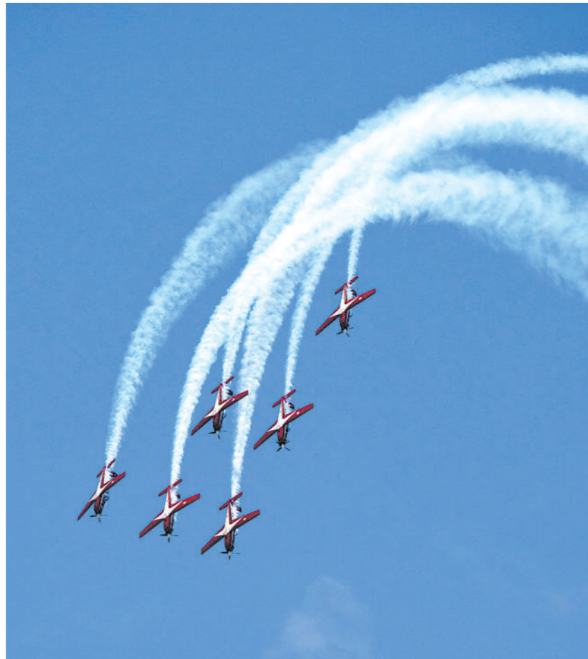
2月15日,印度尼西亚空军特技飞行队在新加坡航空展进行飞行表演。新加坡航空展于2月15日至18日举行。

片展揭幕,并线上出席“中墨关系:新合作形式”圆桌对话会。 参议院当天还举行《中墨关系50周年:过去、当下和未来》文集推介会。该文集由墨参议院和墨西哥国立自治大学中国研究中心编写出版,内容涵盖中国经济社会发展的分析解读、经贸合作机遇的商界见解以及墨外交官推动两国关系发展的珍贵回忆。 当晚,墨西哥首都墨西哥城、坎昆、瓜达拉哈拉等城市作为中墨友好城市(省州)代表,在各自标志性建筑物点亮墨西哥国旗主色调和中国红,共同展现两国人民走过半个世纪的友好情谊,并为北京冬奥会送上美好祝福。 同一天,墨西哥邮政局在墨西哥城邮政官举行墨中建交50周年纪念邮票发行仪式。这套邮票共两张,由中墨两国联合发行,图案取材自中国河南登封观星台和墨西哥奇琴伊察玛雅文明遗址的库库尔坎金字塔。 1972年2月14日,中国与墨西哥建立外交关系。2013年,两国关系提升为全面战略合作伙伴关系。