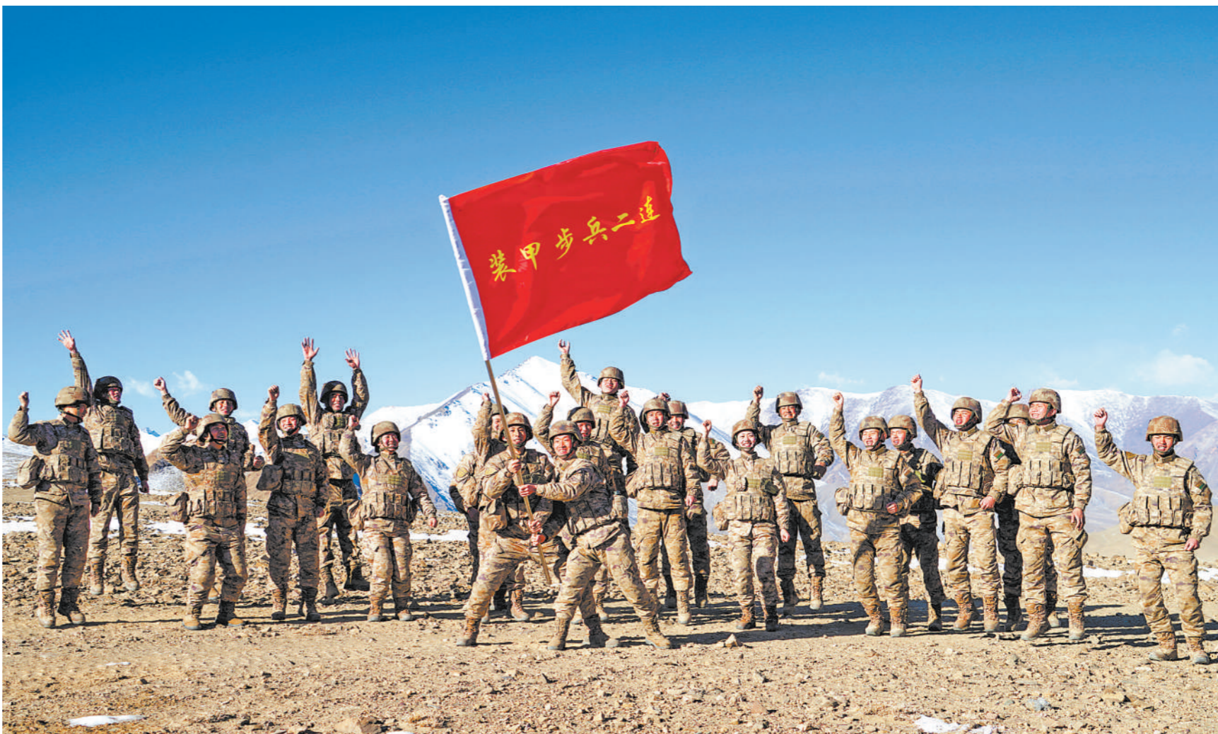
3月2日，新疆军区某团开展要点夺控演练。装甲步兵二连官兵表现突出，挥舞连旗庆祝胜利。

编者按 创先争优，迈向一流。随着《军队功勋荣誉表彰条例》及其实施办法的印发，全军部队迅速掀起新时代立功创模活动热潮，广大官兵聚焦备战打仗，矢志精武强能，奋力岗位建功，涌现出一大批先进单位和模范人物。他们，是军营里最亮的星。请看——