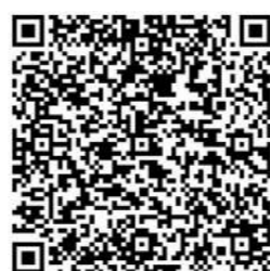
扫描二维码 观看视频教程

需要注意的是，由于各地医保政策不同，备案流程也有所不同。当参保地的备案方式为“自助开通”时，备案提交后，无需审核便可实时查看备案结果；若参保地备案方式为“快速备案”时，备案提交后，需要等待2-3个工作日。