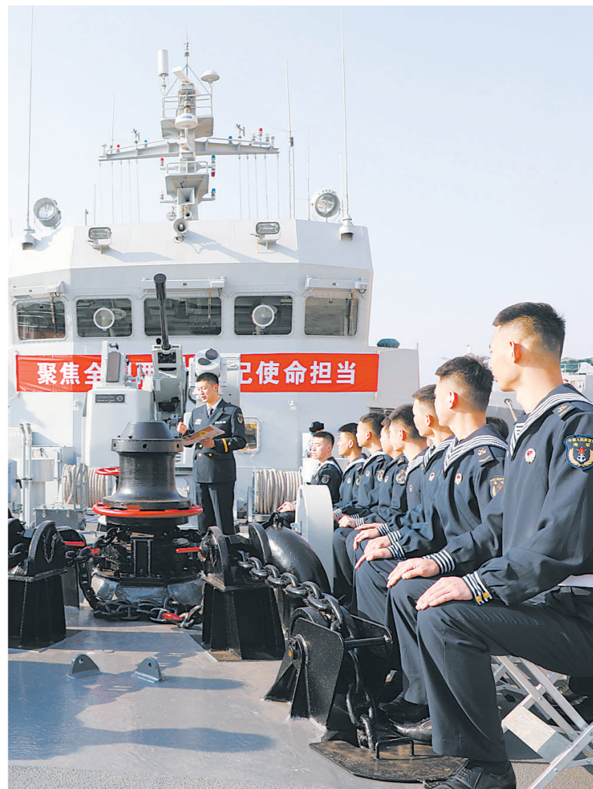
连日来，各部队采取多种形式学习全国两会精神。上图：北部战区海军某扫雷舰大队干部带头领学。下图：第72集团军某旅官兵讨论交流。