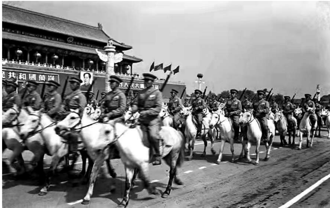
1950年，内蒙古军区骑兵部队骑马进京参加国庆阅兵，接受党和人民的检阅。资料图片

彻中华大地。党中央根据全国解放战争形势的发展，把战略决战的方向首先指向东北战场。