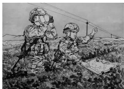
确定站立点和目标点