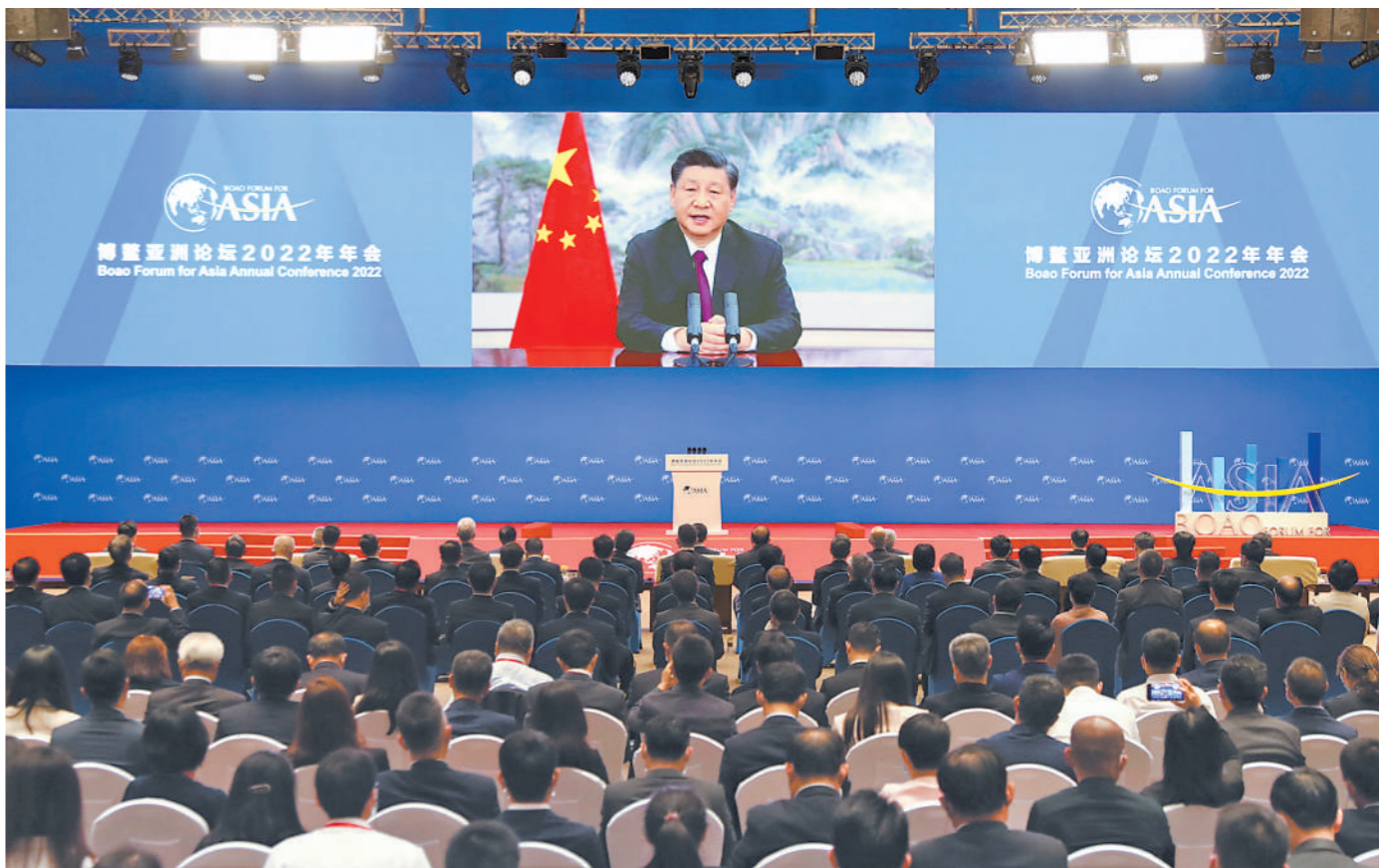
4月21日上午,博鳌亚洲论坛2022年年会开幕式在海南博鳌举行,国家主席习近平以视频方式发表题为《携手迎接挑战,合作开创未来》的主旨演讲。