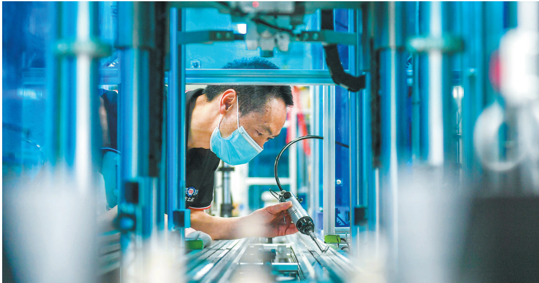
4月25日，浙江省湖州市长兴经济技术开发区，技术人员在加工新能源汽车空调压缩机部件。今年以来，各地坚持“动态清零”总方针不动摇，出台多项政策举措，助力有序生产。