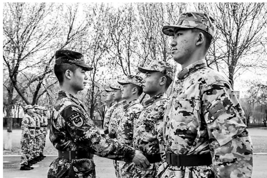
4月11日，武警天津总队新兵五大队依据队列条令组织开展训练，增强新兵队列素养。