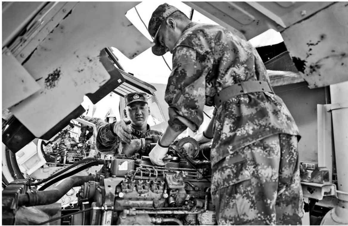
近日，新疆军区某工兵团严格落实装备管理相关法规制度，组织开展装备保养工作，确保武器装备始终处于良好状态。

近年来，该部采取有力措施，落实各项法规制度，常态化开展廉洁教育，培育廉洁文化，筑牢官兵反腐倡廉的思想防线，部队风清气正的良好氛围越来越浓厚。