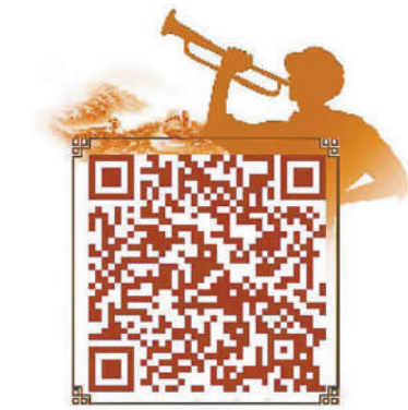
扫一扫，听“长征副刊”往期美文