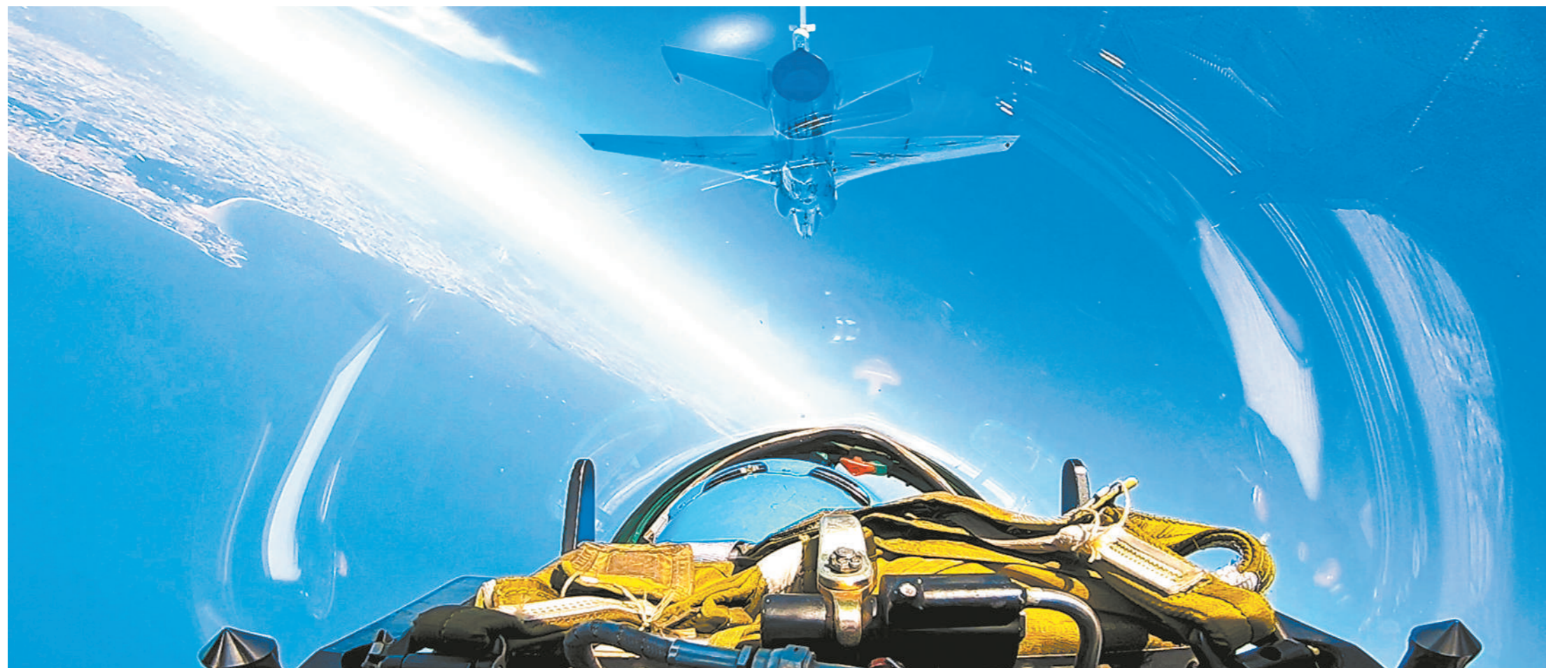
近日，海军航空大学某团组织跨昼夜飞行训练。

机关服务贴心，官兵后顾之忧。近期，该支队多名官兵通过法律服务热线咨询的个人和家庭涉法涉诉问题，均得到有效解决。