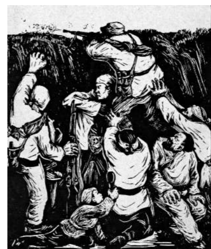
《当敌人搜山的时候》(版画) 彦涵作

延安的新年画借鉴民间艺术质朴热烈的表现手法，装饰性强，具有鲜明的艺术特色。罗工柳的《儿童团检查路条》、莫朴的《参军光荣》等形象突出，画面鲜明，色彩浓厚，富有中国画的显著特征；张晓非的《识一千字》、力群的《丰衣足食》等构图饱满，表现形式新颖独特，民族风格鲜明；彦涵的《军民合作 抗战胜利》、杨筠的《努力织布 坚持抗战》等，通过丰富的情节，表现了边区军民联合抗战的精神风貌。