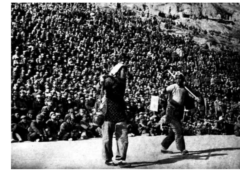
秧歌剧《兄妹开荒》

这一时期，在中国音乐史上诞生了一部具有重要历史意义和深远影响的民族歌剧《白毛女》。作品通过杨白劳和喜儿父女的悲惨遭遇，深刻揭示了旧社会地主阶级与农民之间的尖锐矛盾，热烈歌颂了中国共产党带领人民群众冲破旧社会的藩篱，建立新社会的勇气和决心，生动表述了“旧社会把人逼成‘鬼’，新社会把‘鬼’变成人”的主题。在音乐写作中，创作者将西方歌剧的音乐体裁形式与我国丰富的民族音乐文化相结合，采用我国北方地区传统的音乐语言，通过极富特色的“板腔体”结构形式，生动刻画剧中人物，展现了人物间的戏剧冲突。作品一经演出就受到群众和部队官兵的喜爱，在群众中产