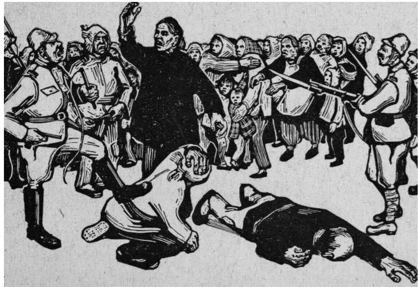
《马本斋将军的母亲》(版画) 罗工柳作

1942年5月，延安文艺座谈会在杨家岭召开。会上，毛泽东同志鲜明地提出“文艺为工农兵服务”的价值导向，指出“人民”与“人民生活”在文艺创作中的核心位置，强调更有效地发