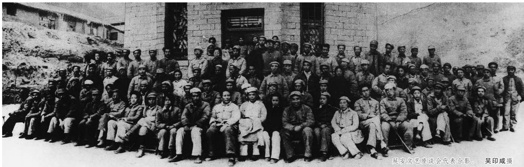
延安文艺座谈会代表合影。

1942年5月2日是延安文艺座谈会召开的日子,吴印咸和参会代表陆续来到杨家岭中央办公厅楼下的会议室。吴印咸看到,这里摆放着许多凳子和椅子,挨门口放着一张长方桌,一块白布铺在桌上,这就是会议主席台。大家都很激动,静候毛主席和其他领导同志到