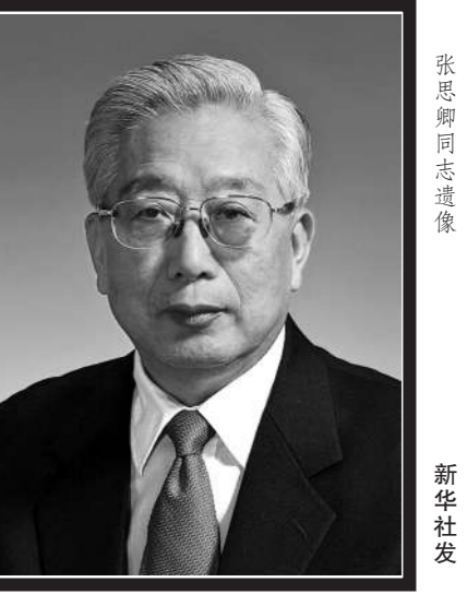
张思卿同志遗像

新华社北京6月17日电 中国共产党的优秀党员，久经考验的忠诚的共产主义战士，我国政法战线的杰出领导人，中国人民政治协商会议第九届、十届全国委员会副主席，最高人民检察院原检察长张思卿同志，因病于2022年6月17日1时52分在北京逝世，享年90岁。