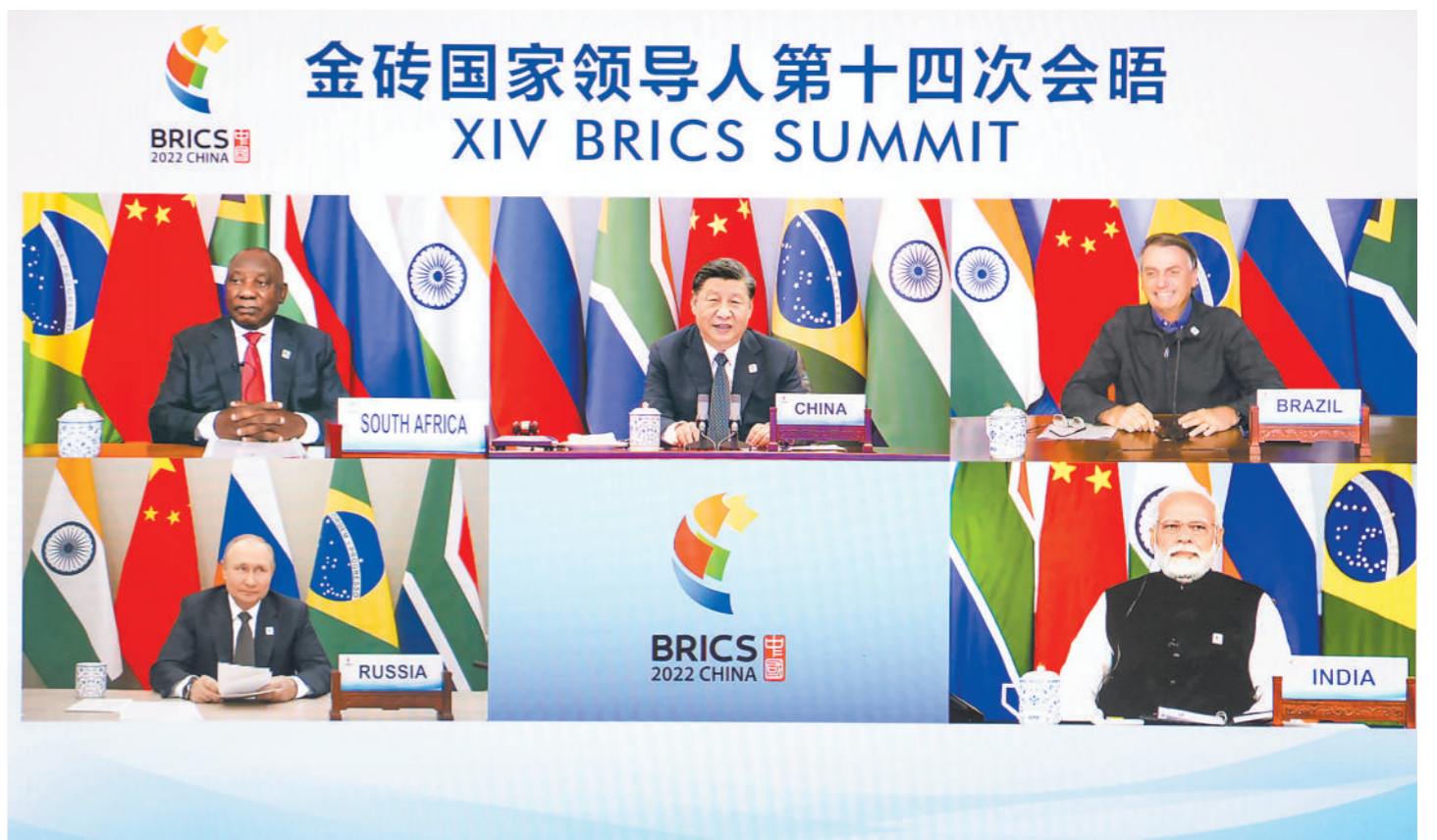
6月23日晚，国家主席习近平在北京以视频方式主持金砖国家领导人第十四次会晤并发表题为《构建高质量伙伴关系 开启金砖合作新征程》的重要讲话。南非总统拉马福萨、巴西总统博索纳罗、俄罗斯总统普京、印度总理莫迪出席。

新华社北京6月23日电（记者杨依军）国家主席习近平23日晚在北京以视频方式主持金砖国家领导人第十四次会晤。南非总统拉马福萨、巴西总统博索纳罗、俄罗斯总统普京、印度总理莫迪出席。