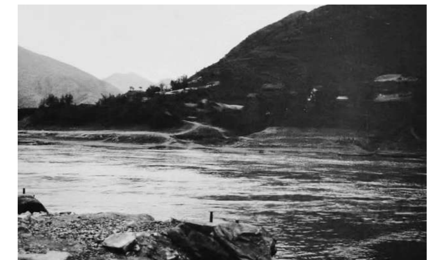
土城，红军一渡赤水河渡口之一。