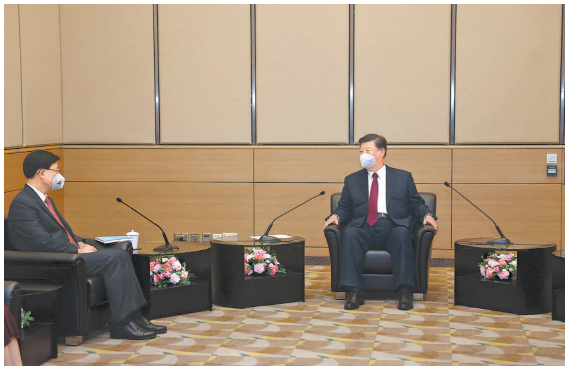
七月一日上午,国家主席习近平在香港会见刚刚就职的香港特别行政区行政长官李家超。