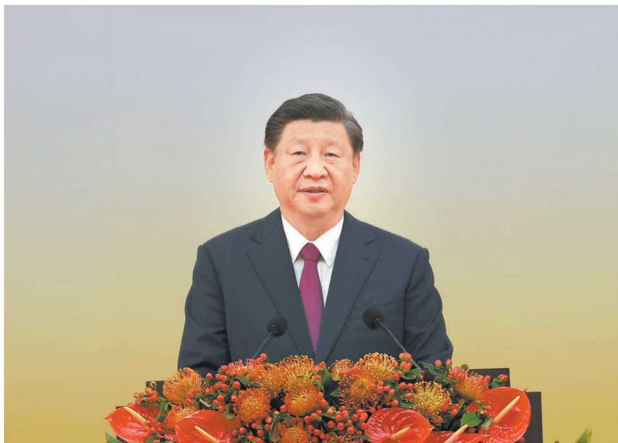
7月1日上午,庆祝香港回归祖国25周年大会暨香港特别行政区第六届政府就职典礼在香港会展中心隆重举行。中共中央总书记、国家主席、中央军委主席习近平出席并发表重要讲话。

习近平强调,25年来,在祖国全力支持下,在香港特别行政区政府和社会各界共同努力下,“一国两制”实践在香港取得举世公认的成功。“一国两制”是经过实践反复检验了的,符合国家、民族根本利益,符合香港、澳门根本利益,得到14亿多中国人民鼎力支持,得到香港、澳门居民一致拥护,也得到国际社会普遍赞同。这样的好制度,没有任何理由改变,必须长期坚持