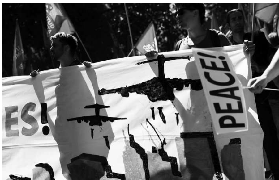
示威者在西班牙马德里参加反对北约峰会的抗议活动。

毫无疑问，新“战略概念”文件突出“大国竞争”的基调，是根据美国的战略意图而设定，其目的是配合美国全方位打压对手，维护美式霸权。然而，文件中对“威胁”和“挑战”的区分认定，表明美欧之间在安全关切和地缘战略考量上的不同，也反映出北约欧洲成员国在对华问题上并不完全认同美国的看法。