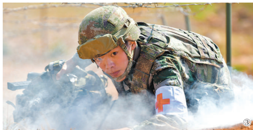
图①：第75集团军某合成旅勤务保障营利用各种自然条件组织官兵强化抢救战车训练。图②：该旅勤务保障营官兵正在进行油样识别训练。图③：该旅勤务保障营卫生员正在进行专业训练。