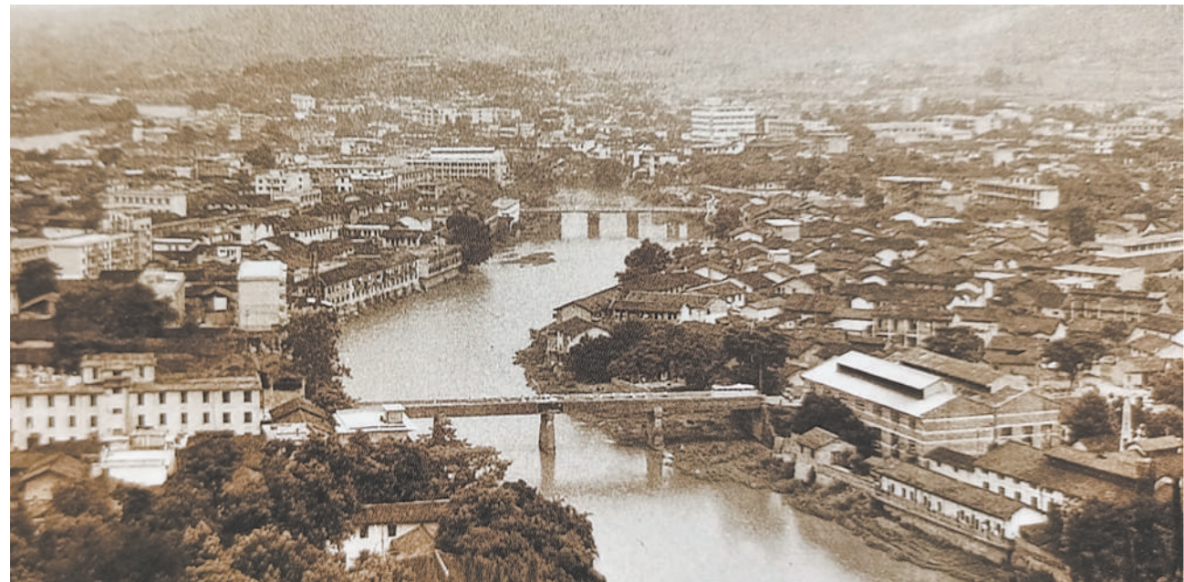
朱德率南昌起义军抵达江西大余后,在这里整编部队和整顿部队的党、团组织。