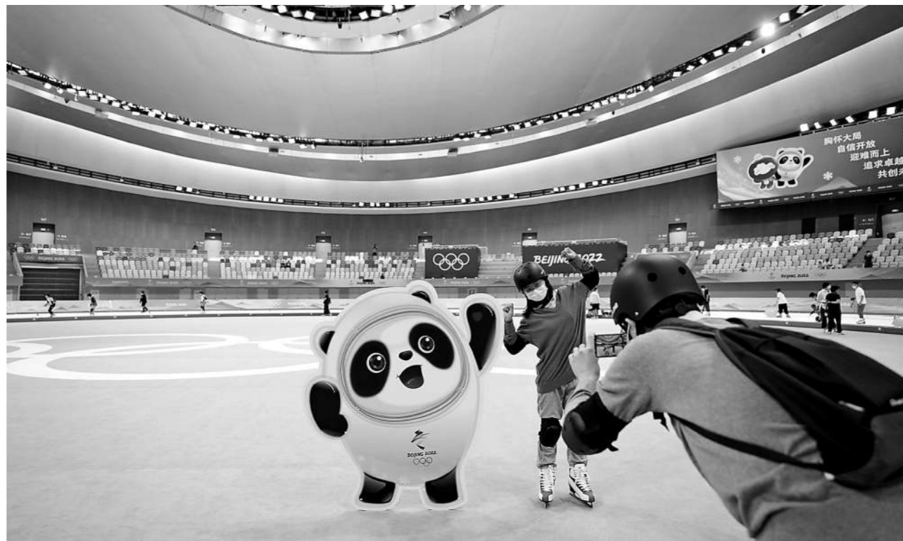
7月9日,北京冬奥会标志性场馆——国家速滑馆正式对外开放,参观群众可近距离接触体验北京冬奥会“最快的冰”。图为参观者与“冰墩墩”合影留念。

作为第一届从筹办之初就系统性规划赛后利用的奥运会,北京冬奥会的闭幕,揭开了奥运遗产赛后利用的序幕。如今,以冬奥场馆的开放为新起点,冬奥遗产携手胸怀大局、自信开放、迎难而上、追求卓越、共创未来的北京冬奥精神,“一起向未来”。