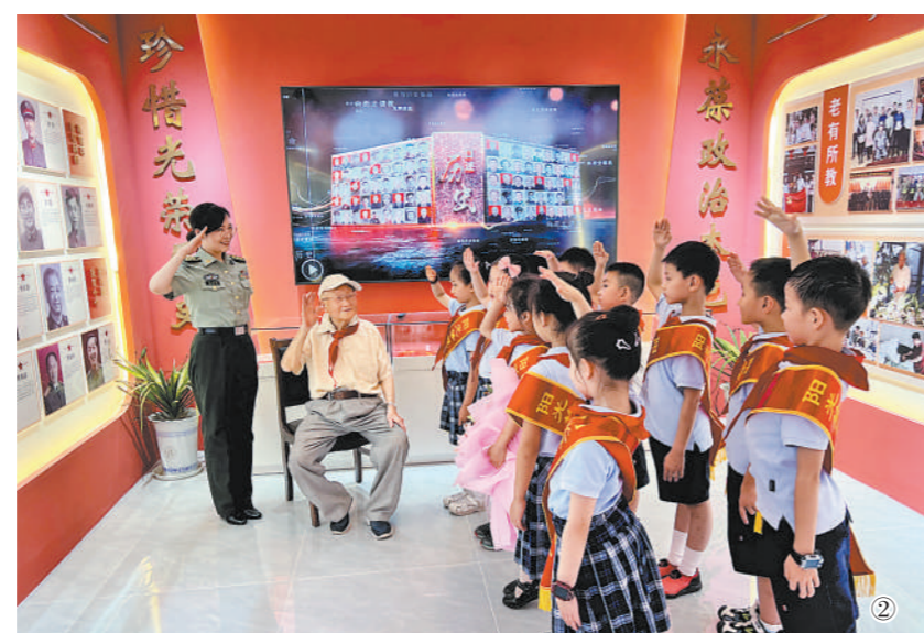
图①：8月15日，群众在中国人民

位于湖南省芷江侗族自治县的中国人民抗日战争胜利受降纪念馆，15日举行以“胜利的这一天”为主题的群众性活动，纪念日本战败并宣布无条