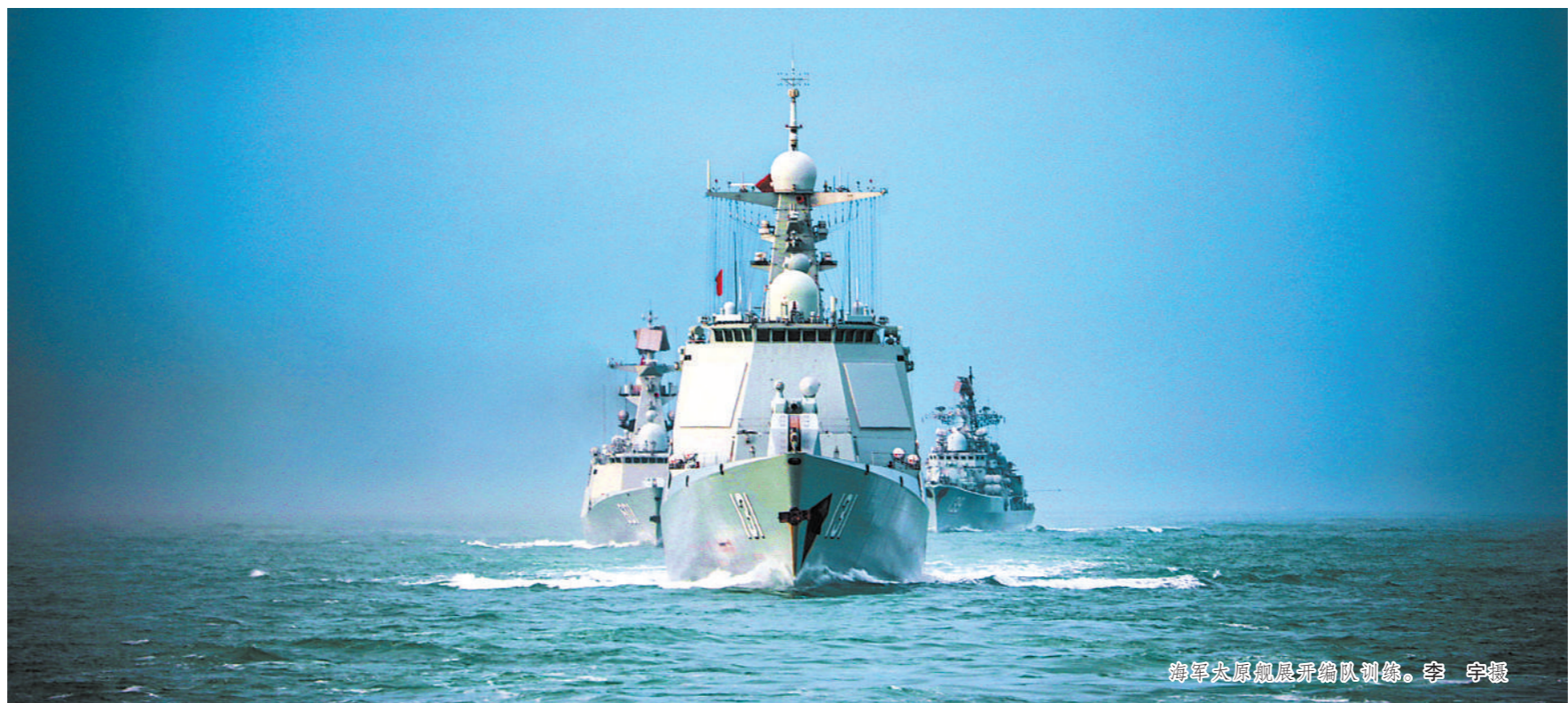
海军太原舰展开编队训练。