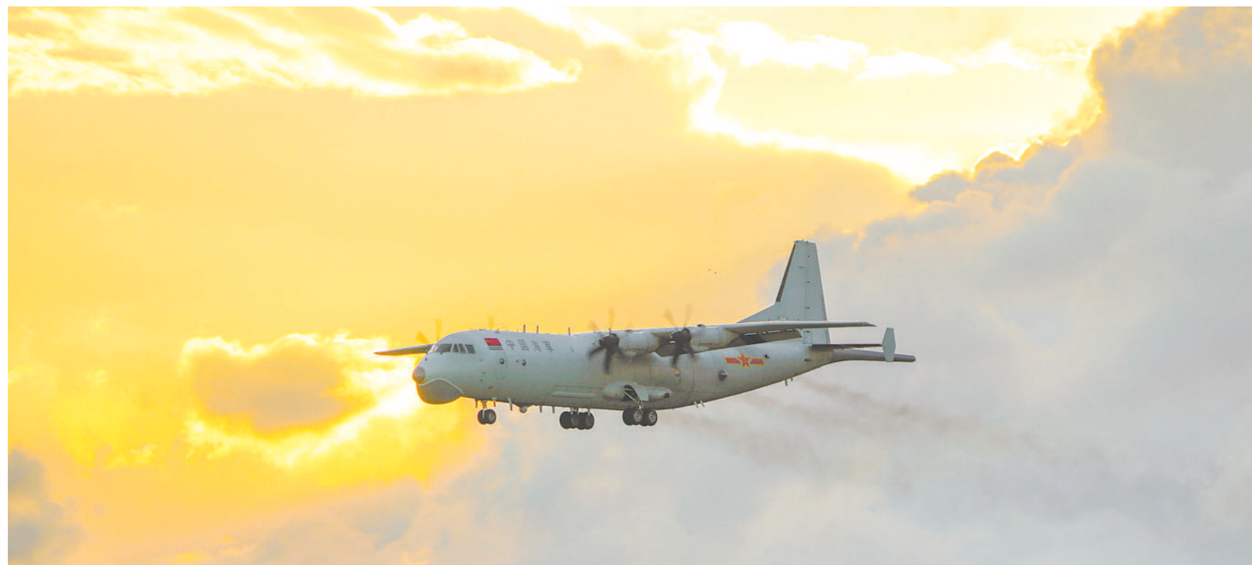
8月3日，南部战区海军航空兵某团开展实战化训练。

通过参与活动，该支队官兵依法处理问题的意识得到加强。前不久，该支队一名战士返乡休假期间，其亲属与他人发生纠纷。这名战士理智地予以劝阻，并向当地执法部门反映情况，最终依法妥善解决问题。