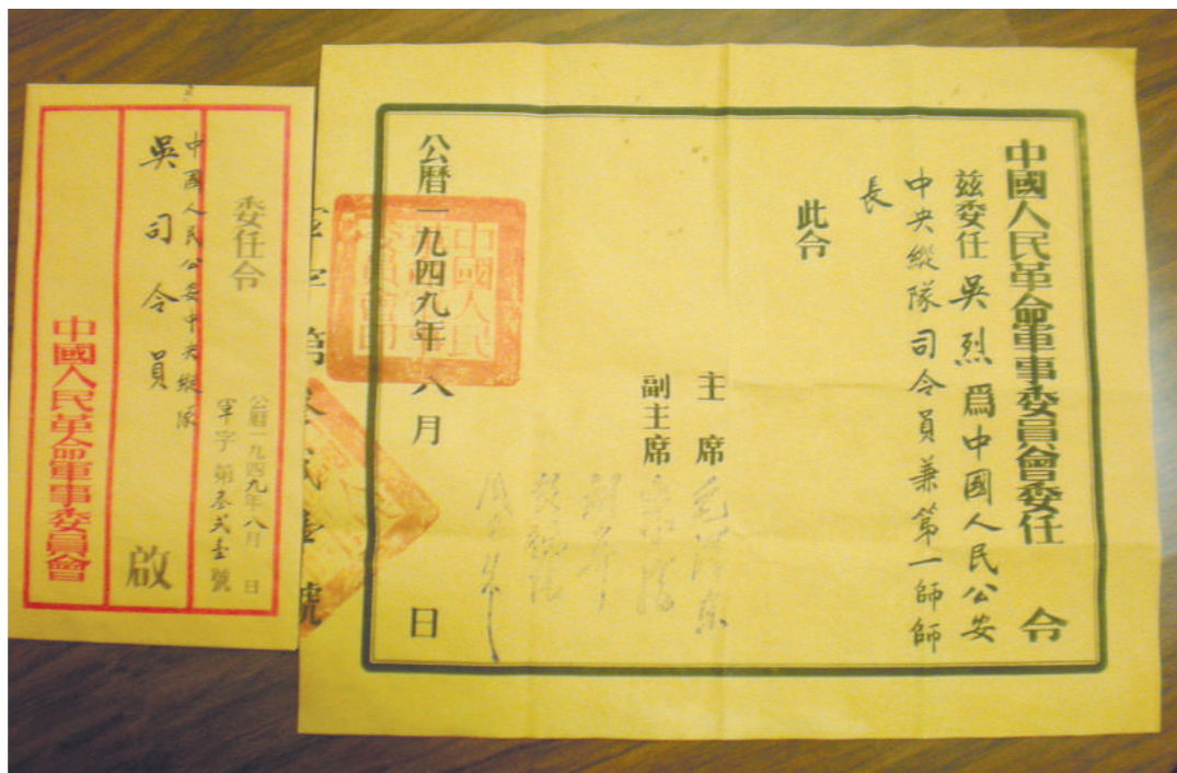
1949年,吴烈任中国人民公安中央纵队司令员兼第1师师长的任命书。资料图片