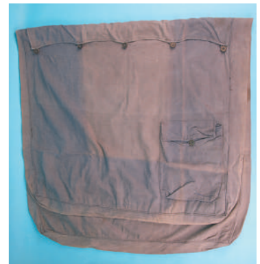
下图:毛泽东在转战陕北期间使用过的马褡子。资料图片

1948年3月23日,毛泽东从陕西省吴堡县川口渡口东渡黄河,进入山西。5月下旬,到达西柏坡。