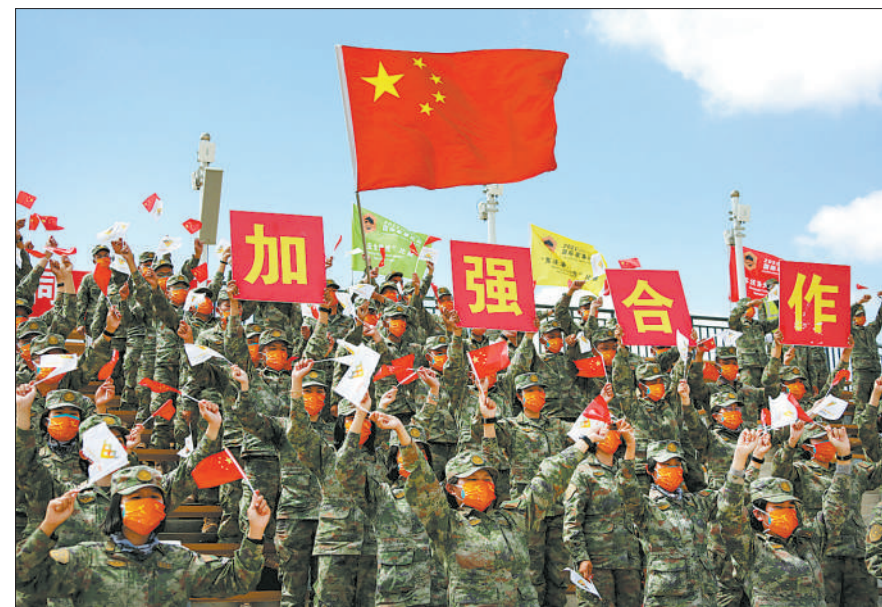
8月18日，“国际军事比赛-2022”中国库尔勒赛区，我军观赛官兵为参赛队员加油。