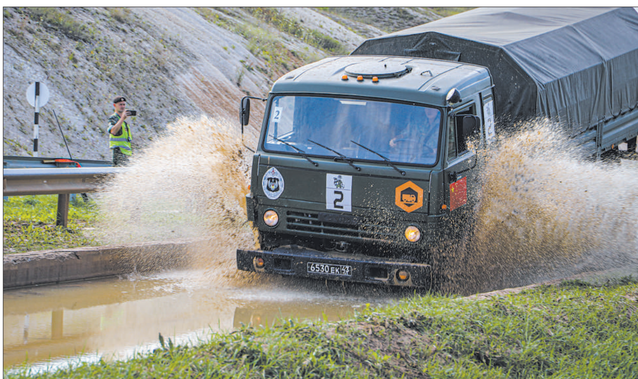
俄罗斯当地时间8月18日，在“汽车能手”项目比赛中，我军选手驾驶运输车通过复杂路段。