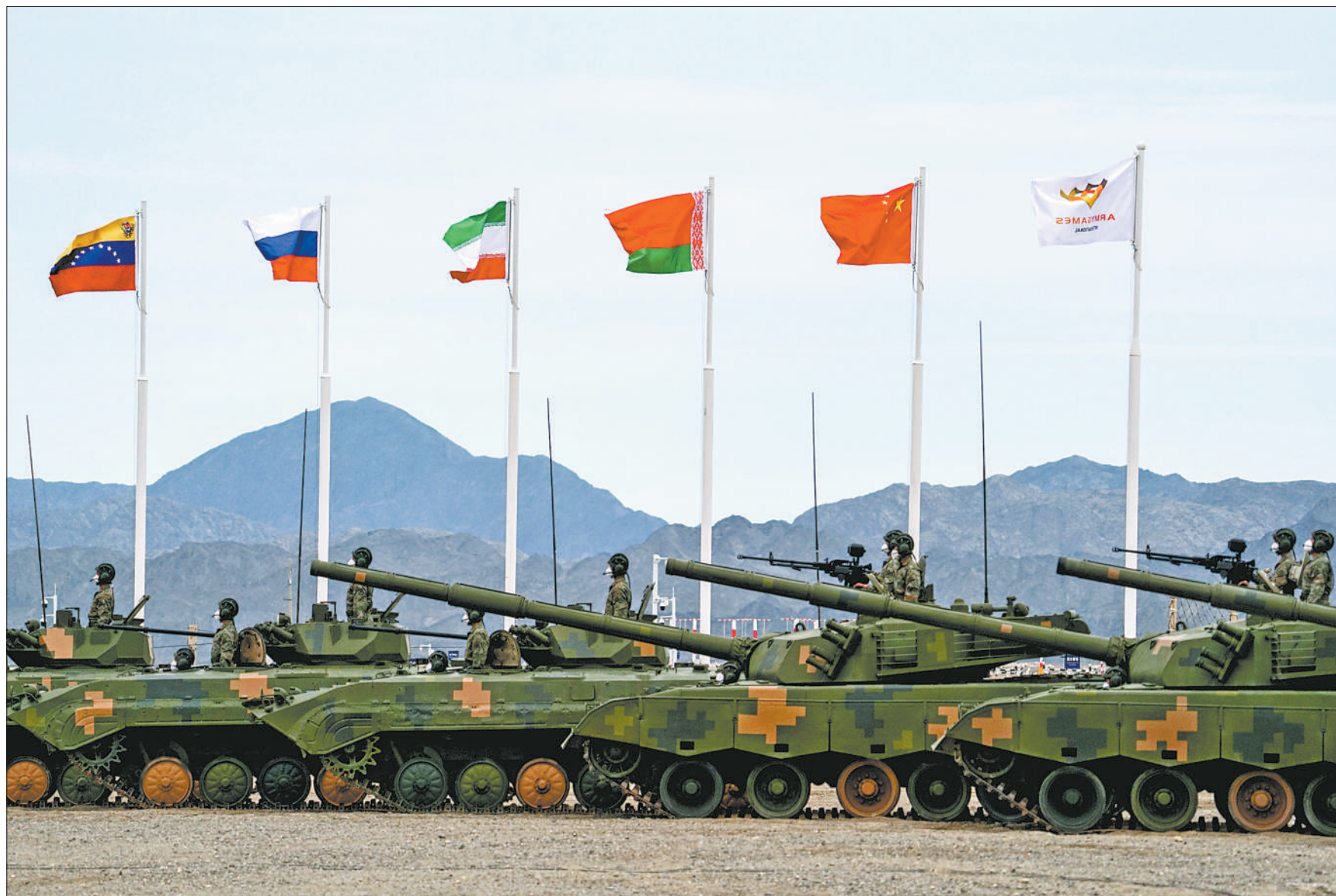
8月13日，“国际军事比赛-2022”中国库尔勒赛区开幕式现场。