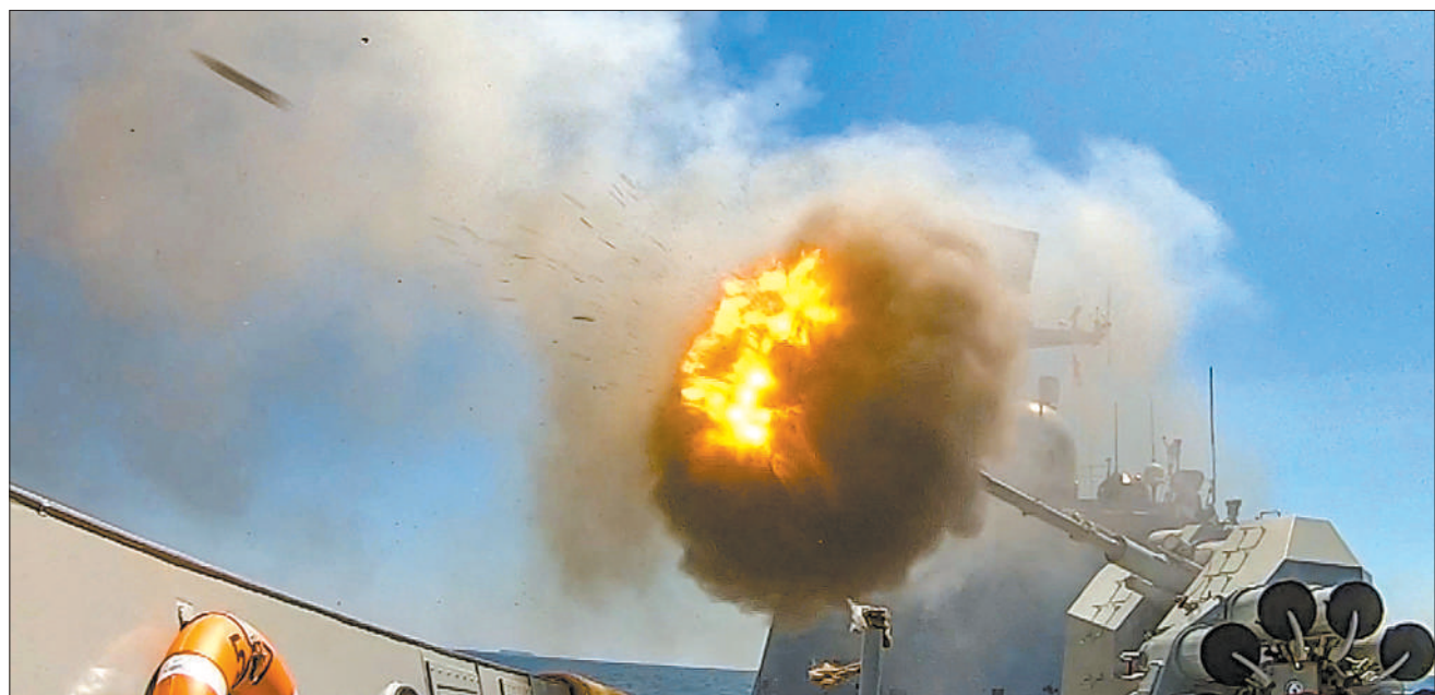
8月17日，在中国青岛赛区举行的“海洋之杯”水面舰艇专业比赛中，我军参赛舰艇进行主炮射击。