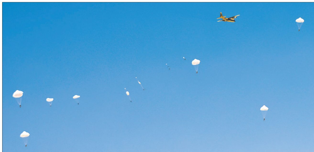
阿尔及利亚当地时间8月19日，在“空降集结与急行军”课目比赛中，我军空降兵参赛队员跳离飞机。