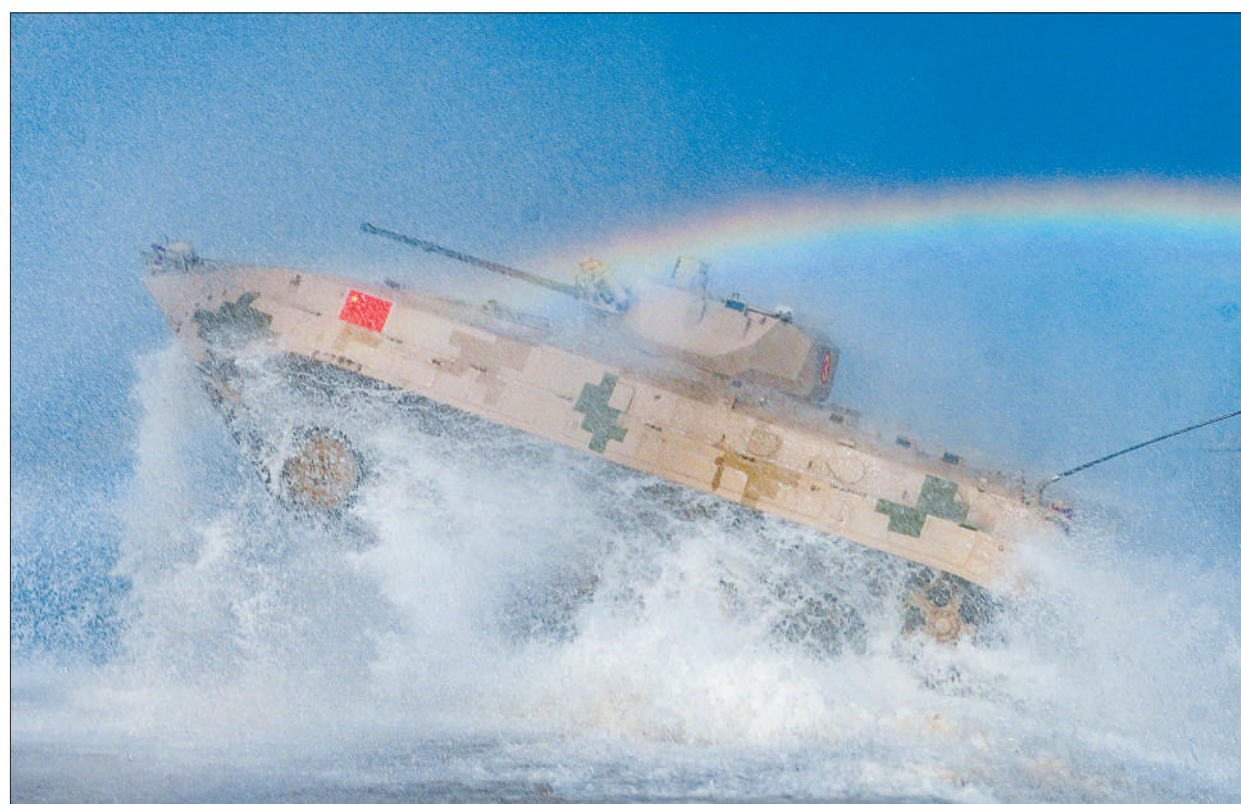
8月18日，在中国库尔勒赛区举行的“苏沃洛夫突击”单车赛第三轮比赛中，我军参赛车队冲出涉水场。