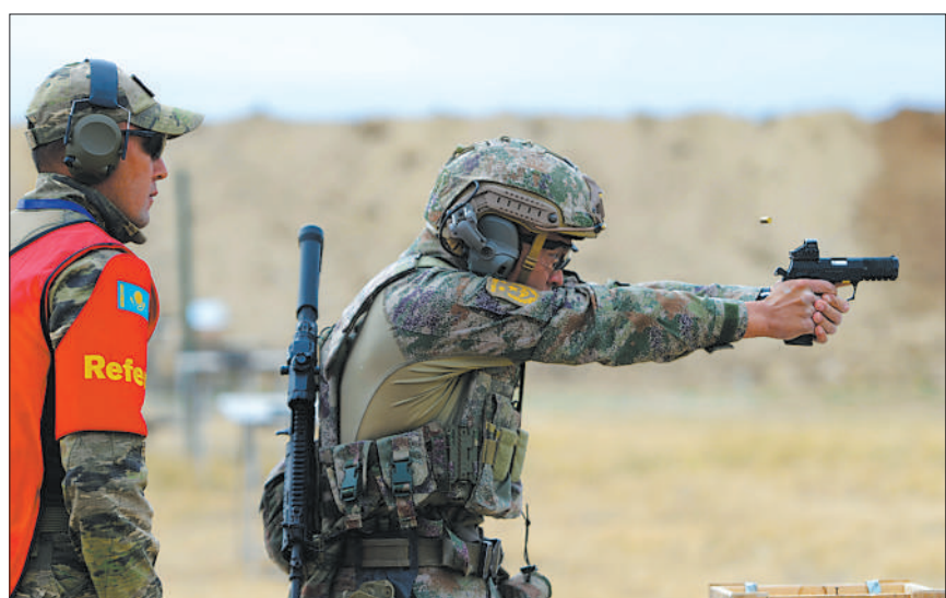
哈萨克斯坦当地时间8月20日，在“战术射手”项目对决赛中，我军参赛队员(右)进行手枪射击。