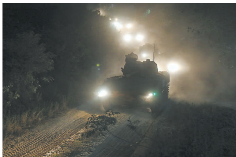
装甲编队夜间机动。