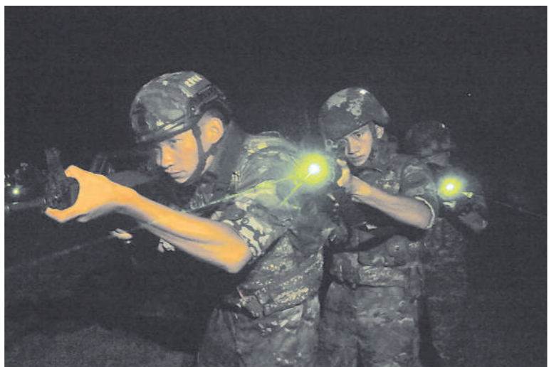
侦察队员向目标逼近。