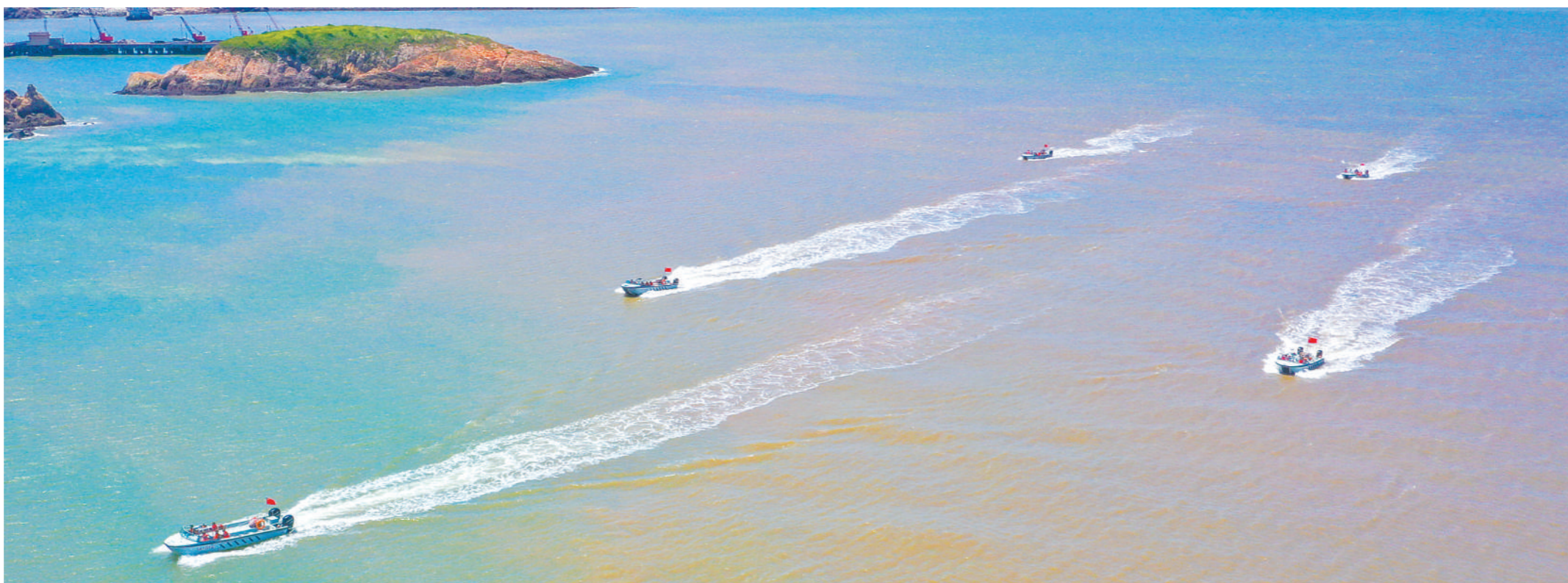
八月上旬,陆军某旅组织官兵进行操舟训练。

该场站领导介绍,他们强化特情处置演练的同时,还注重引导官兵强化专业知识的学习与掌握,不断提高技术水平。目前,该场站的军医和卫生员大多通过了空军组织的“1+N”岗位资格认证。