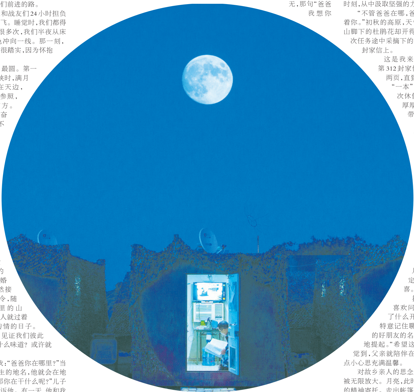
月下戈壁军营。