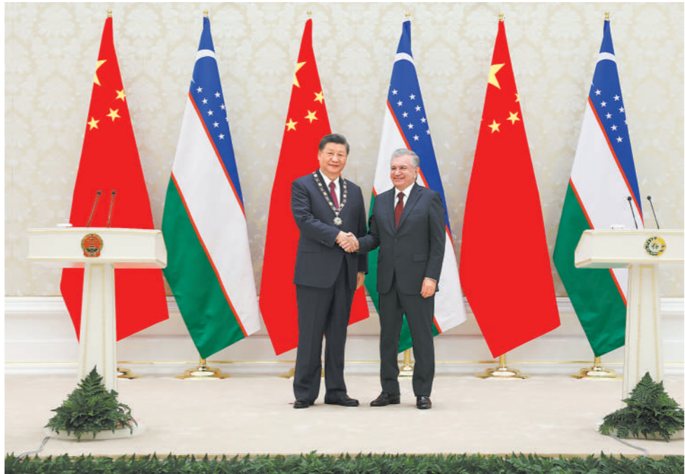
当地时间9月15日,国家主席习近平在撒马尔罕国际会议中心接受乌兹别克斯坦总统米尔济约耶夫授予“最高友谊”勋章。

新华社乌兹别克斯坦撒马尔罕9月15日电 (记者刘华、蔡国栋)当地时间9月15日,国家主席习近平在撒马尔罕国际会议中心接受乌兹别克斯坦总统米尔济约耶夫授予“最高友谊”勋章。