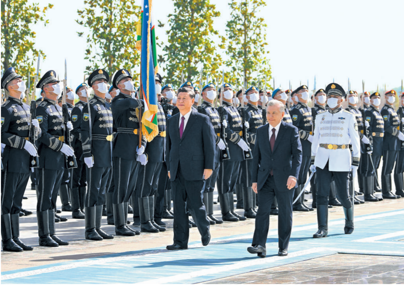
当地时间9月15日,国家主席习近平在撒马尔罕同乌兹别克斯坦总统米尔济约耶夫会谈。会谈前,米尔济约耶夫为习近平举行隆重欢迎仪式。