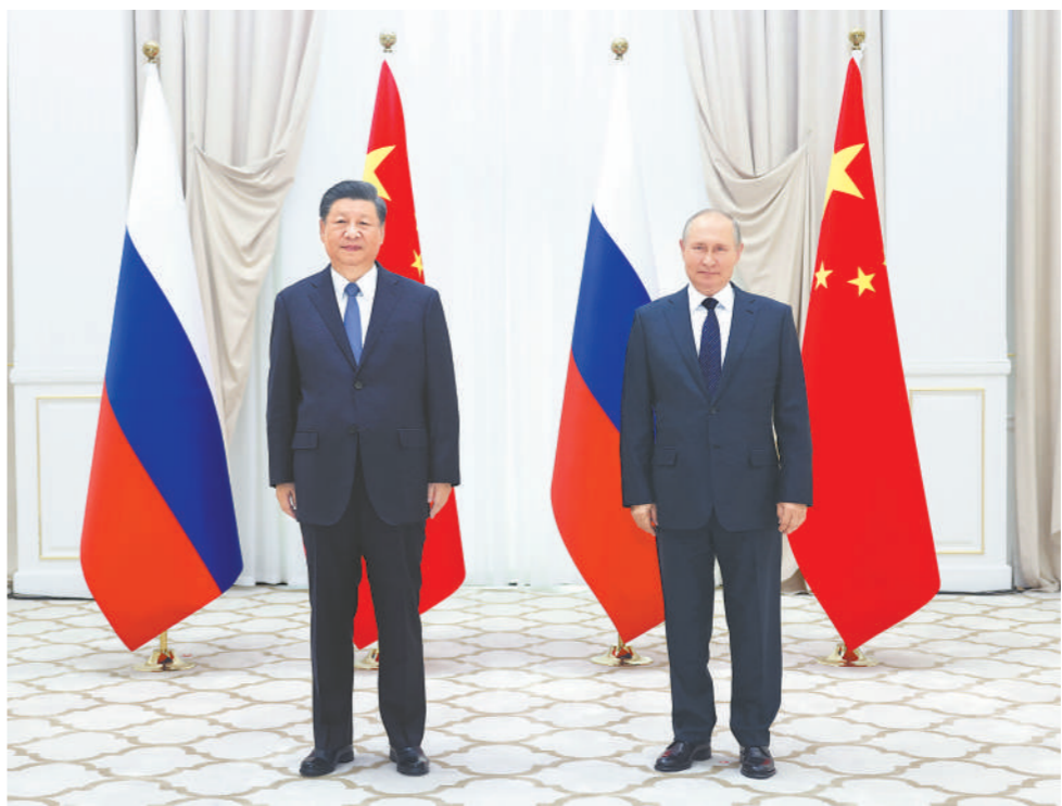
当地时间9月15日下午,国家主席习近平在撒马尔罕国宾馆同俄罗斯总统普京举行双边会见,就中俄关系和共同关心的国际和地区问题交换意见。

新华社乌兹别克斯坦撒马尔罕9月15日电 (记者范伟国、刘华)当地时间15日下午,国家主席习近平在撒马尔罕国宾馆同俄罗斯总统普京举行双边会见,就中俄关系和共同关心的国际和地区问题交换意见。