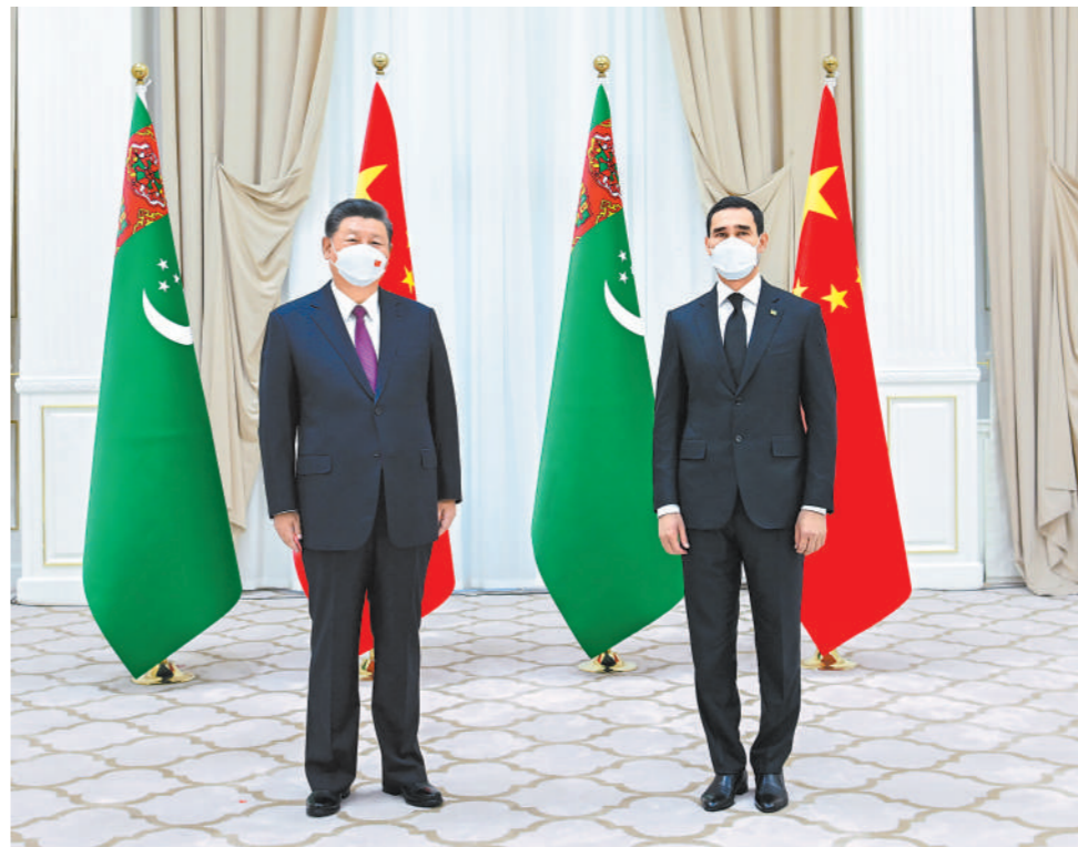
当地时间9月15日上午,国家主席习近平在撒马尔罕国宾馆会见土库曼斯坦总统谢尔达尔·别尔德穆哈梅多夫。