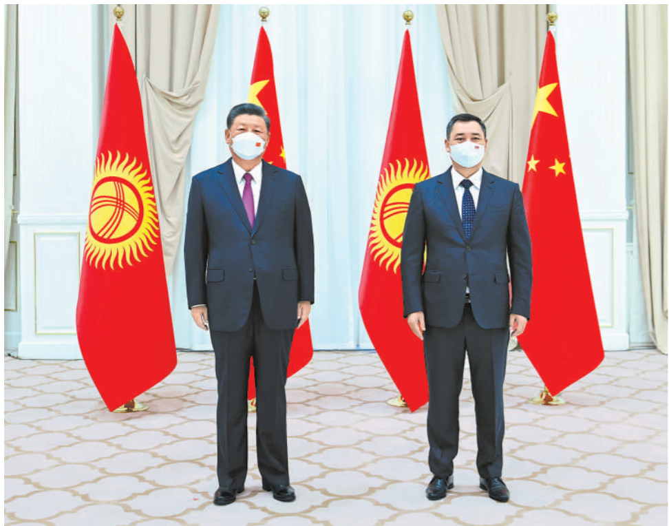
当地时间9月15日上午,国家主席习近平在撒马尔罕国宾馆会见吉尔吉斯斯坦总统扎帕罗夫。