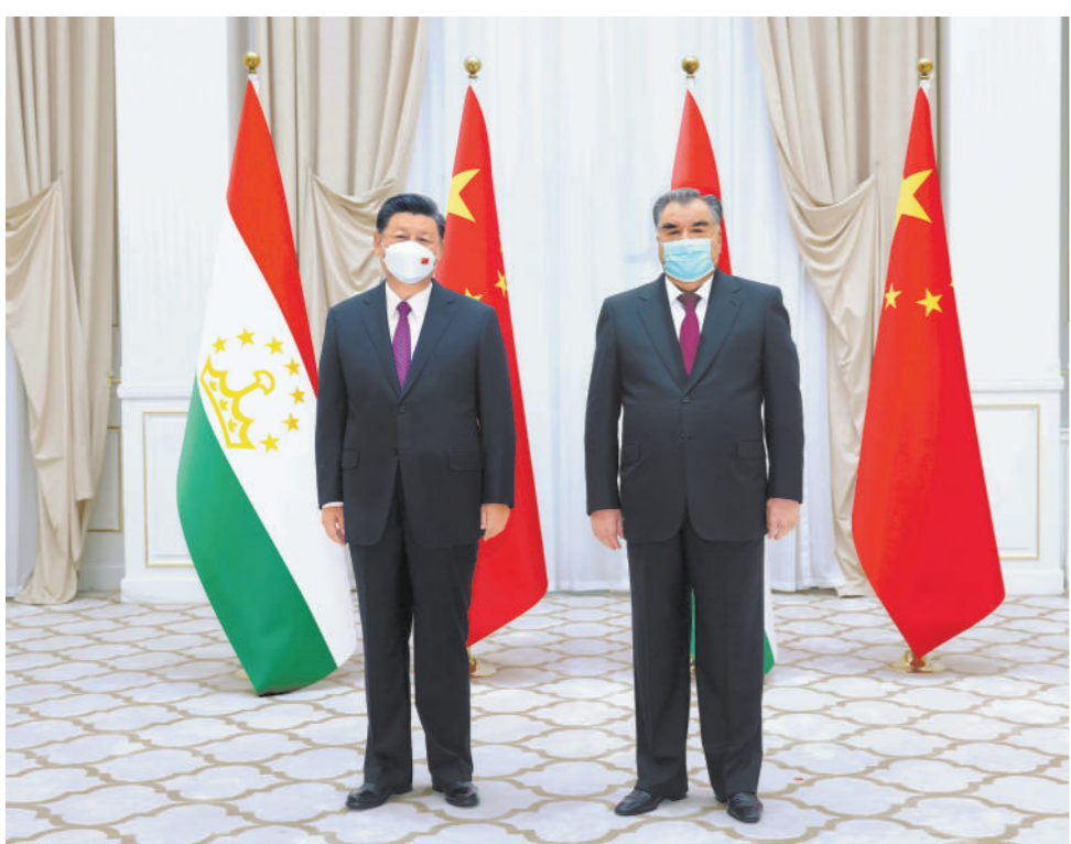
当地时间9月15日上午,国家主席习近平在撒马尔罕国宾馆会见塔吉克斯坦总统拉赫蒙。