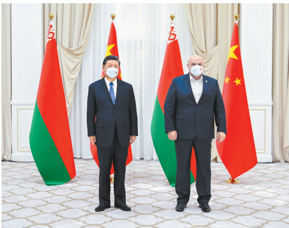
当地时间9月15日下午,国家主席习近平在撒马尔罕国宾馆会见白俄罗斯总统卢卡申科。

国宾馆会见白俄罗斯总统卢卡申科。两国元首决定,将双边关系定位提升为全天候全面战略合作伙伴关系。