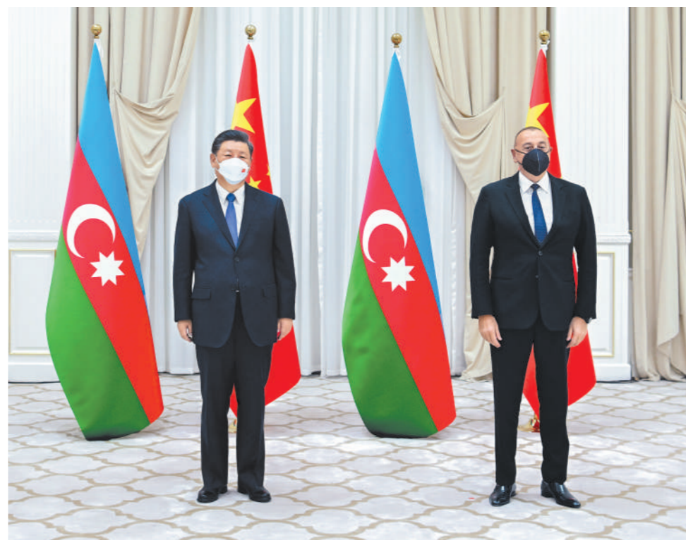
当地时间9月15日下午,国家主席习近平在撒马尔罕国宾馆会见阿塞拜疆总统阿利耶夫。