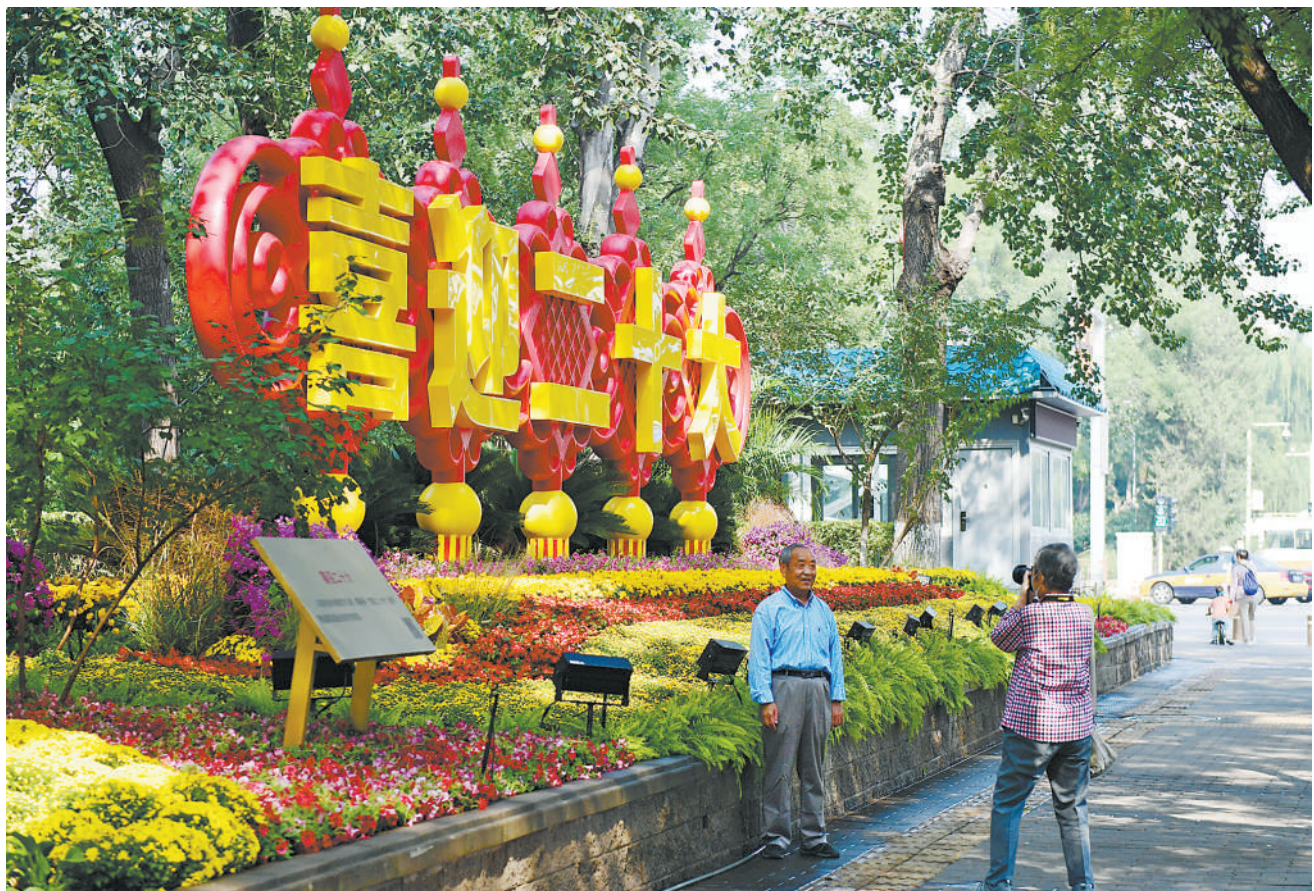
国庆节假期日益临近，北京天安门广场的“祝福祖国”巨型花果篮及长安街沿线14组立体花坛精彩亮相。图为9月27日，市民在京西宾馆附近的“喜迎二十大”花坛前拍照留念。

得的特色品牌。 “即将召开的党的二十大将开启更加幸福美好的新生活。我们要鼓足干劲，打造军民合力推进乡村振兴的新样板。”总队领导表示，他们将进一步深化党建引领，充分发挥党员先锋模范作用，深入开展军民共建社会主义精神文明活动，书写军民鱼水情的时代新篇。 前不久，梭梭拉打村旅游观光基地建成。不少游客慕名前来“打卡”，给这个小山村带来蓬勃生机。 “人民军队来自人民，为了人民。”总队官兵表示，要牢记宗旨本色，在乡村振兴一线唱响爱民之歌、续写初心答卷，以优异成绩迎接党的二十大胜利召开。