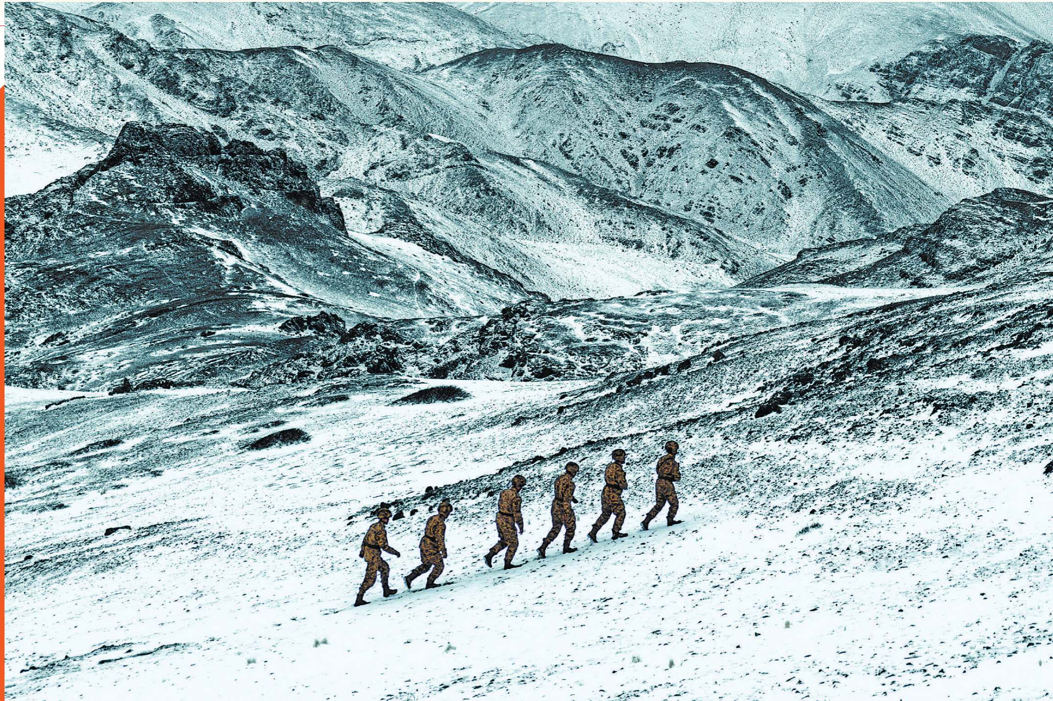
右图：官兵在阵地周边巡逻。

一阵寒风吹过，官兵们对阵地周边展开新一轮巡逻。身着新式作训服的官兵与皑皑雪山融为一体，俨然一幅壮美的水墨画。