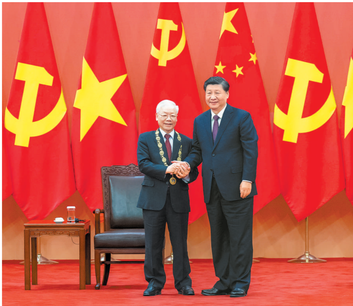
十月三十一日,中共中央总书记、国家主席习近平在北京人民大会堂向越共中央总书记阮富仲授予中华人民共和国“友谊勋章”,并举行隆重颁授仪式。

阮富仲致答辞。阮富仲表示,衷心感谢习近平总书记授予我中华人民共和国“友谊勋章”,这一崇高荣誉体现了中国共产党、政府和人民对越南党、政府和人民以及包括我在内的越南历届领导人的深情厚谊,也是对越南长期致力于中越友好的巨大鼓舞。(下转第三版)