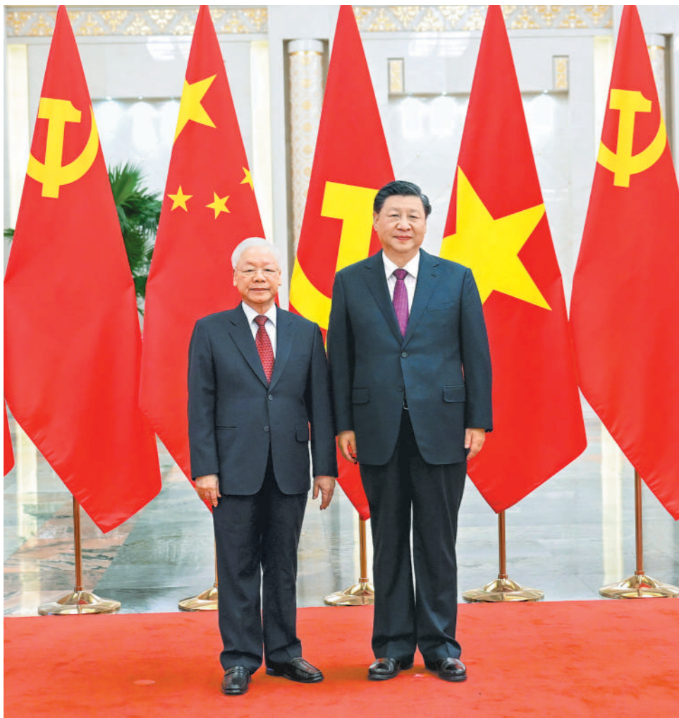
10月31日,中共中央总书记、国家主席习近平在北京人民大会堂同越共中央总书记阮富仲举行会谈。这是会谈前,习近平在人民大会堂北大厅为阮富仲举行欢迎仪式。