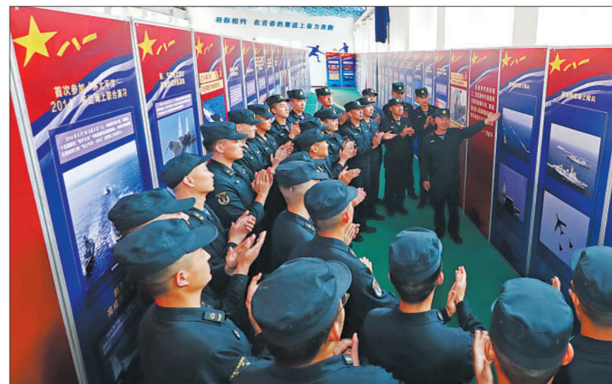
◇海军某护卫舰支队组织官兵参观“向海图强春潮涌”主题展览，感受强军这10年取得的非凡成就。