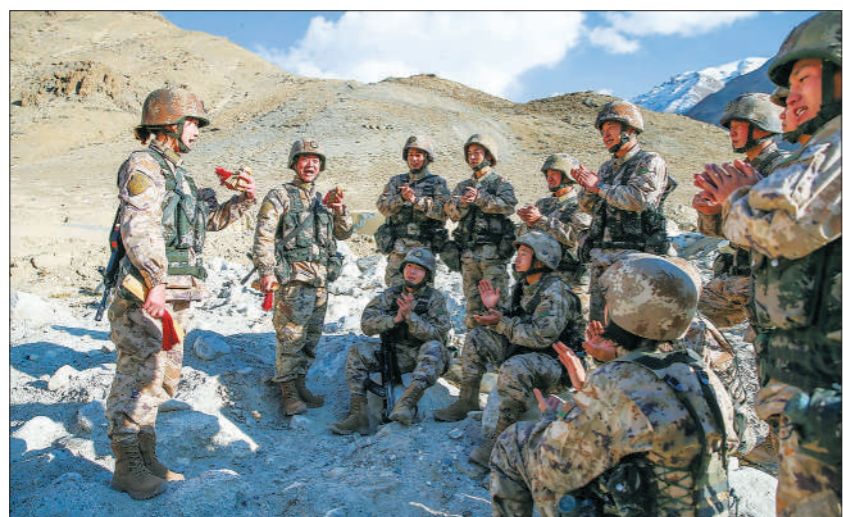
◇正在野外驻训的第76集团军某防空旅，利用“快板书”等官兵喜闻乐见的方式宣传党的二十大精神。