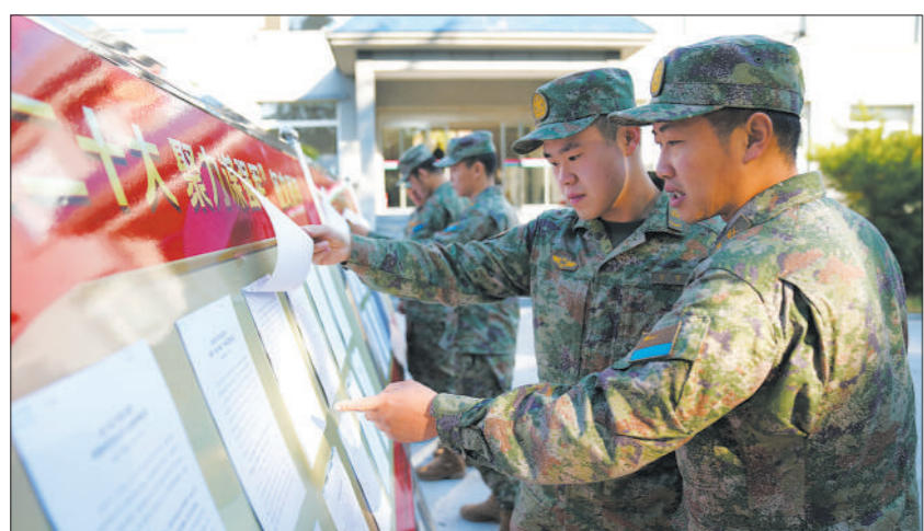
◇空军某后勤训练基地举办党的二十大精神征文展评活动，引导官兵坚守理想信念，坚决听党指挥。