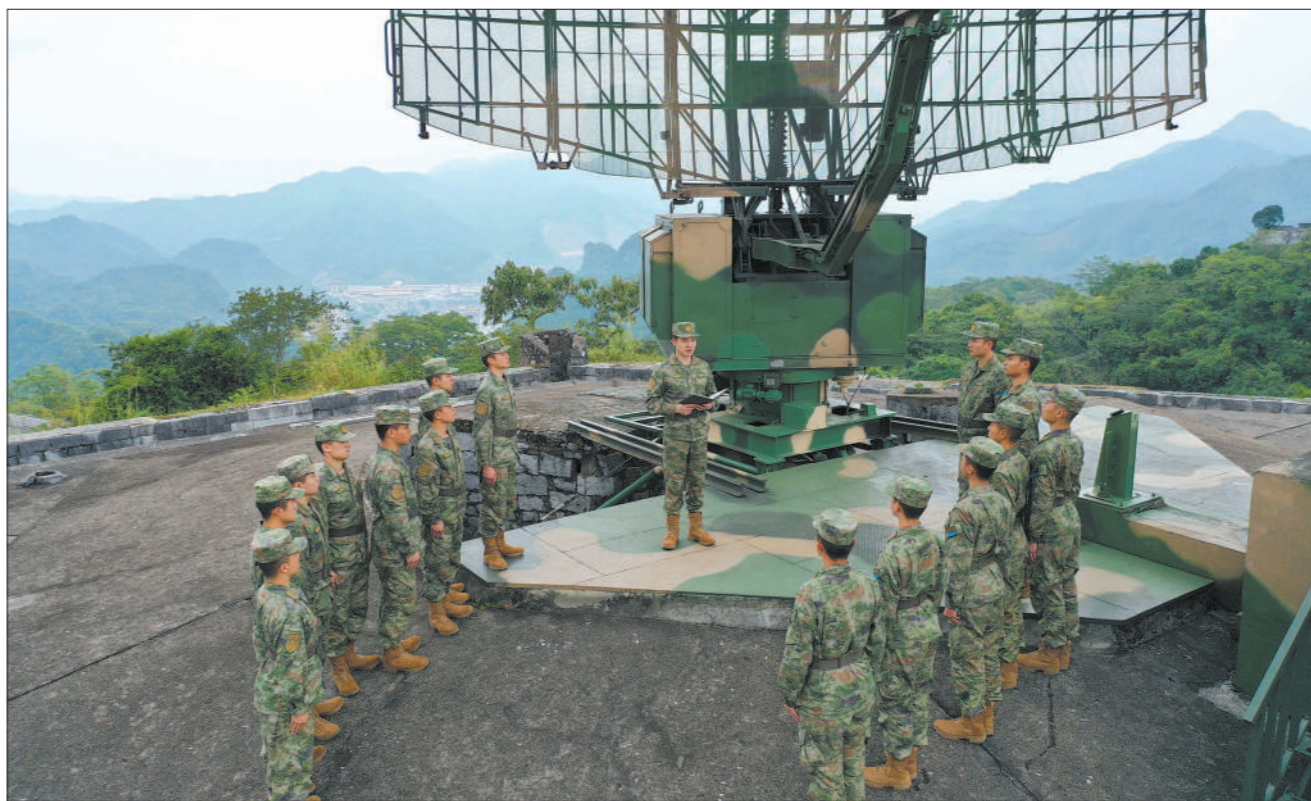
◇空军地导某部创新形式开展教育活动，官兵结合亲身经历讲述学习二十大报告的感悟。