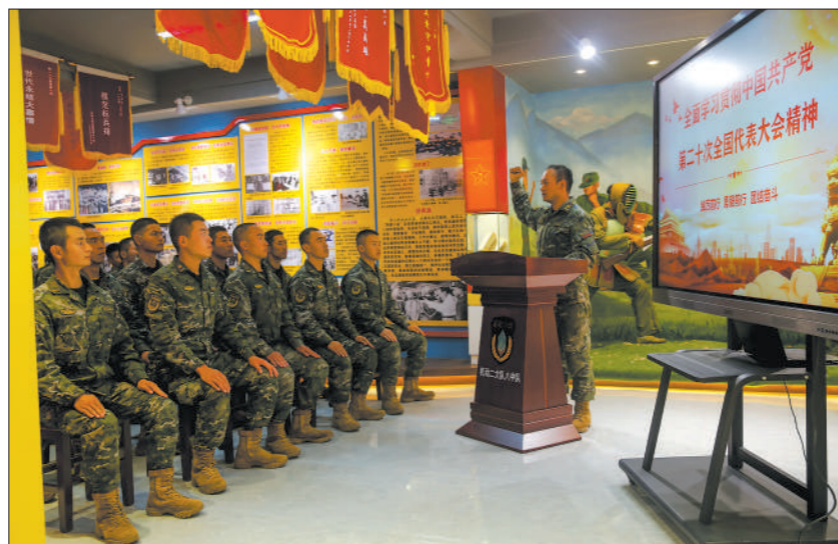
◇武警第一机动总队某支队举办“士兵大讲堂”，官兵通过交流学习体会，深化对党的二十大精神的理解。