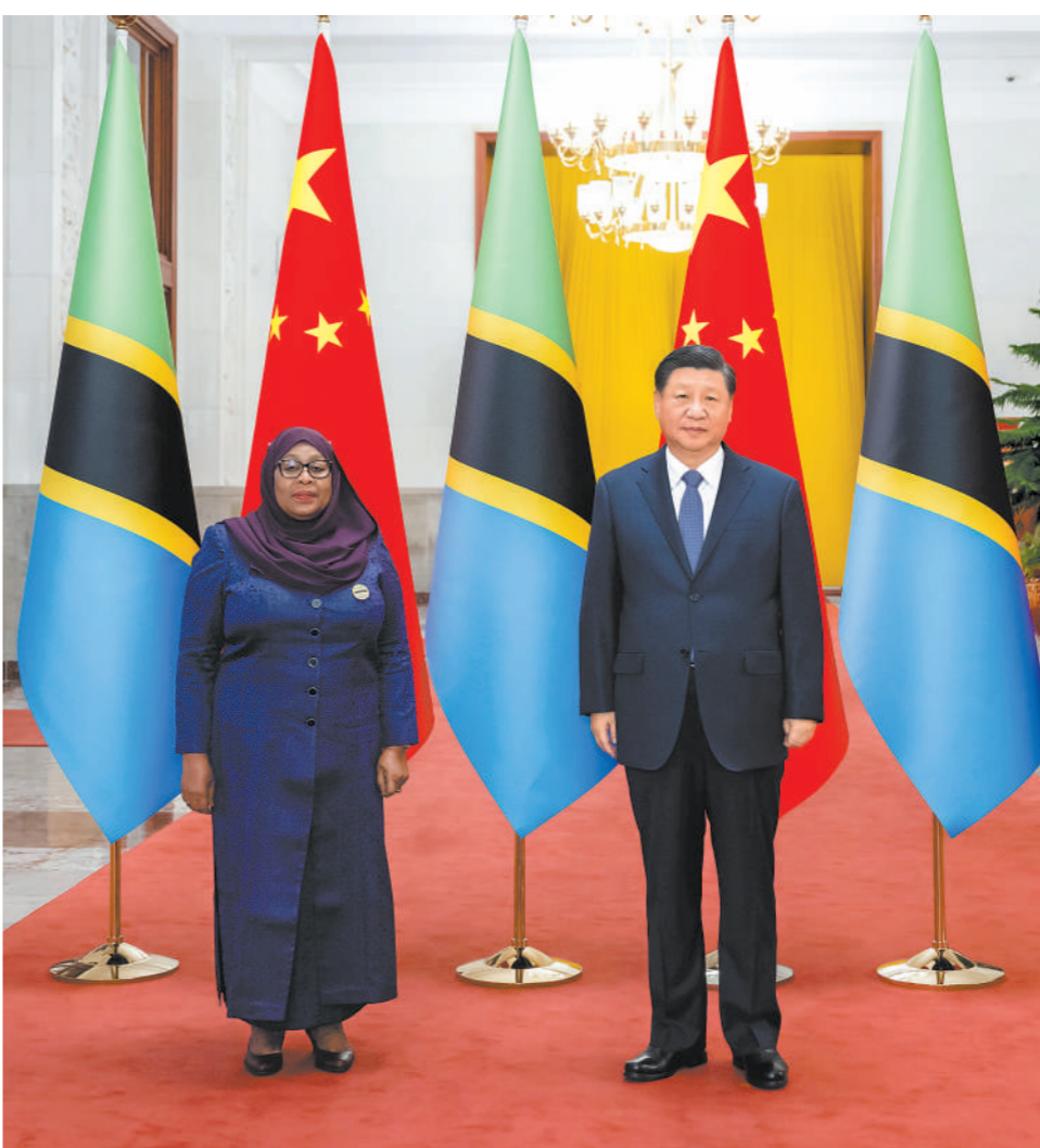
11月3日下午,国家主席习近平在北京人民大会堂同来华进行国事访问的坦桑尼亚总统哈桑举行会谈。这是会谈前,习近平在人民大会堂北大厅为哈桑举行欢迎仪式。