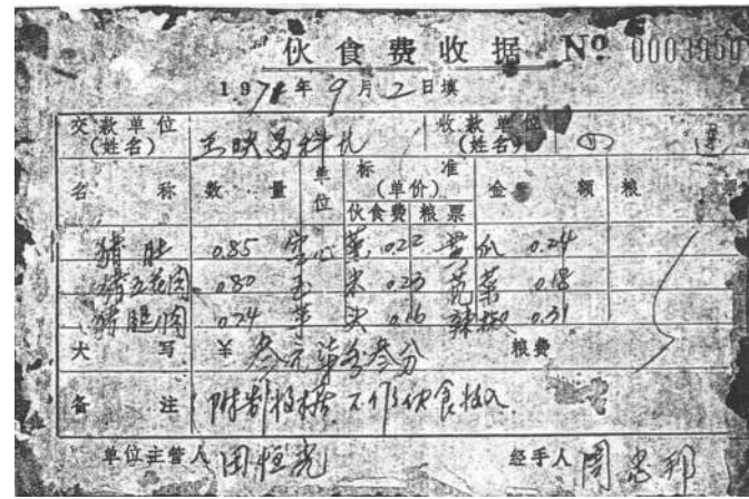
毛主席交纳菜金的收据。 资料图片