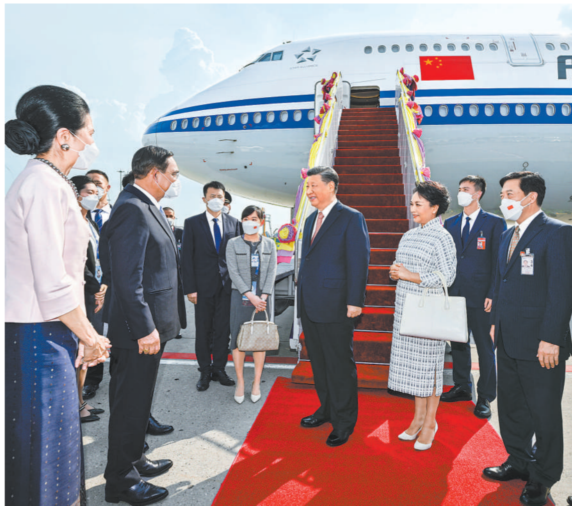
当地时间十一月十七日下午,国家主席习近平乘专机抵达泰国曼谷,出席亚太经合组织第二十九次领导人非正式会议并对泰国进行访问。这是习近平和夫人彭丽媛乘坐的专机抵达曼谷素万那普国际机场时,泰国总理巴育夫妇、副总理兼外长敦夫夫妇、文化部部长伊提蓬夫妇等热情迎接。