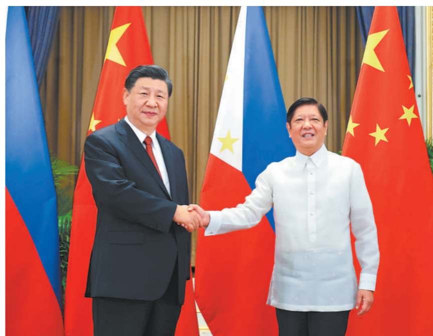
当地时间11月17日下午,国家主席习近平在曼谷会见菲律宾总统马科斯。

新华社曼谷11月17日电 (记者耿学鹏、毛鹏飞)当地时间11月17日下午,国家主席习近平在曼谷会见菲律宾总统马科斯。