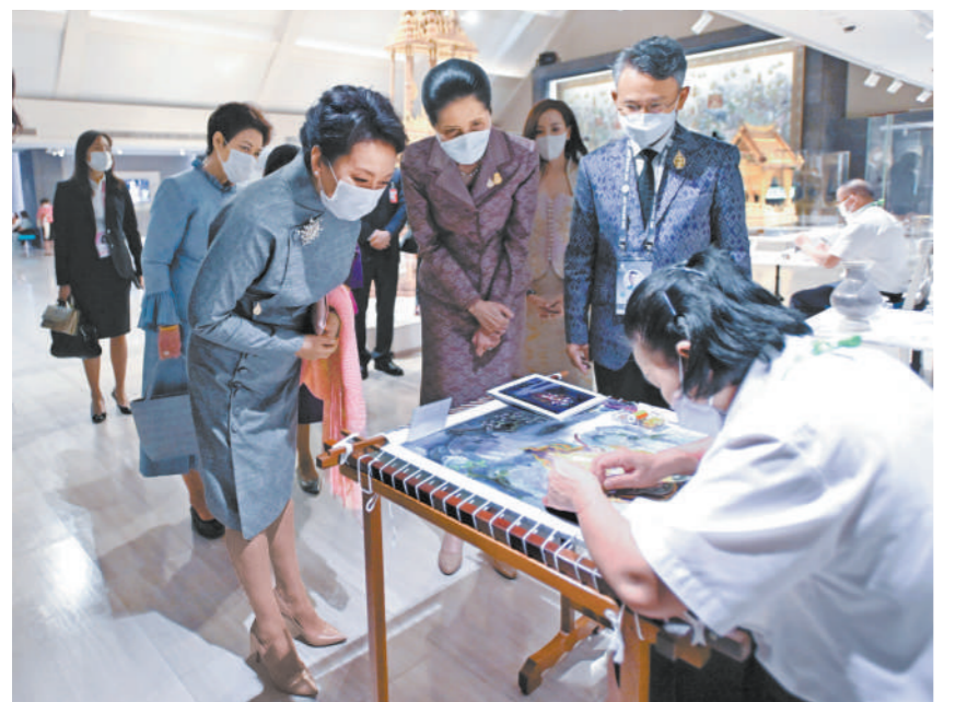
当地时间18日上午,应泰国总理夫人娜拉蓬邀请,国家主席习近平夫人彭丽媛同参加亚太经合组织第二十九次领导人非正式会议的部分经济体领导人及代表的配偶共同参观大城府国家艺术博物馆。这是彭丽媛在娜拉蓬的陪同下参观泰国传统手工艺展示。