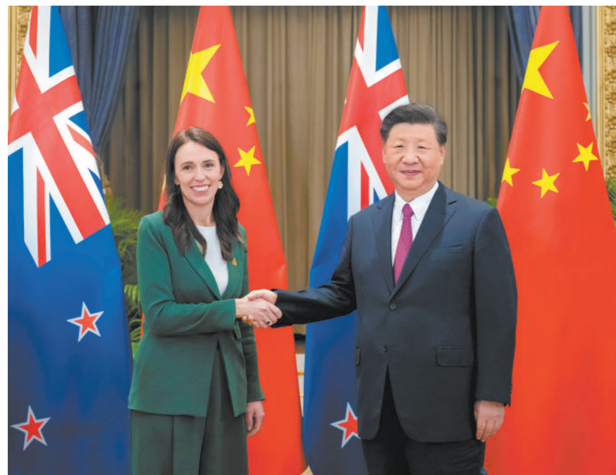
当地时间11月18日下午,国家主席习近平在泰国曼谷会见新西兰总理阿德恩。